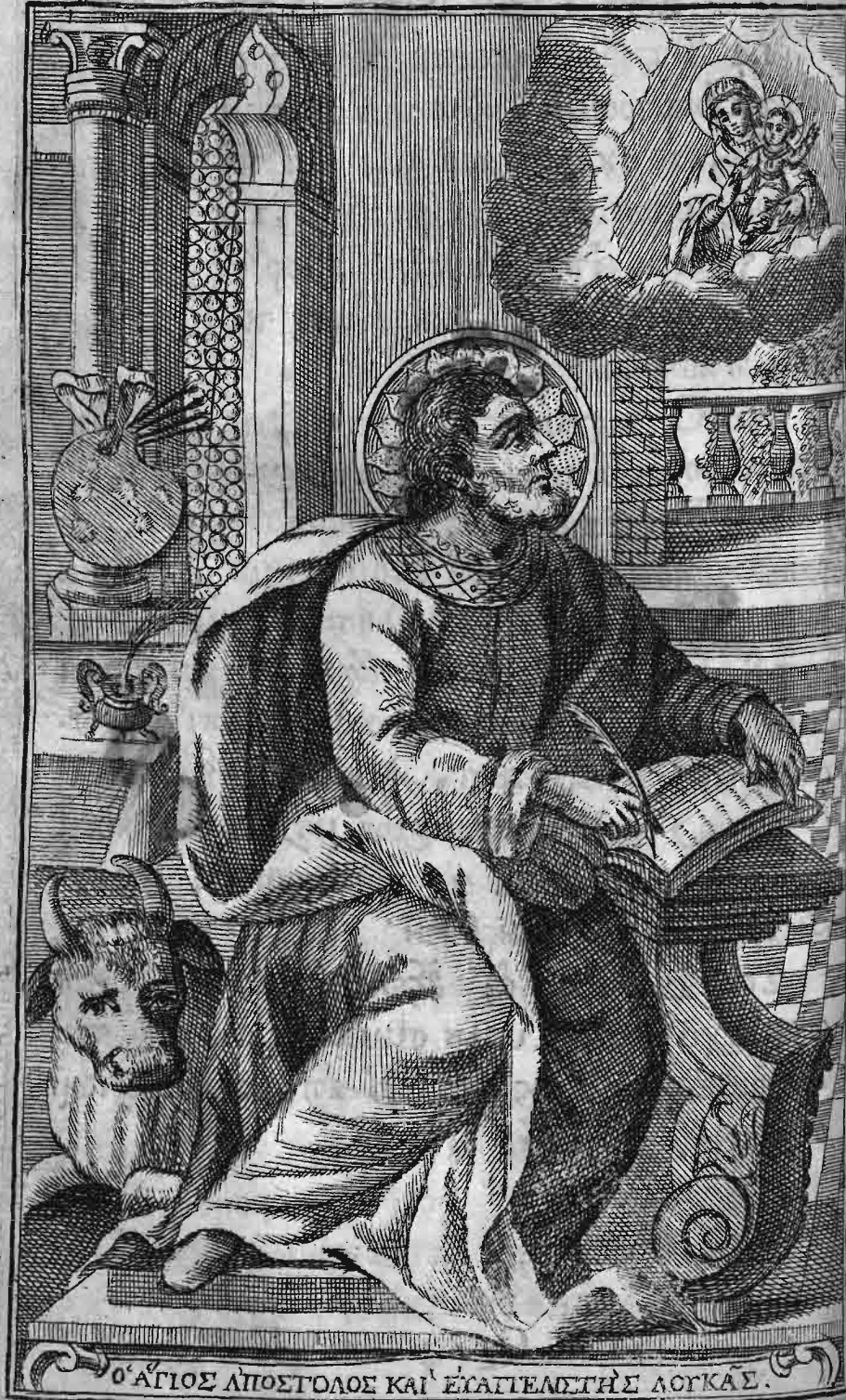
Ο ΆΓΙΟΣ ΑΠΟΣΤΟΛΟΣ ΚΑΙ ΕΥΑΓΓΕΛΙΣΤΗΣ ΛΟΥΚΑΣ.