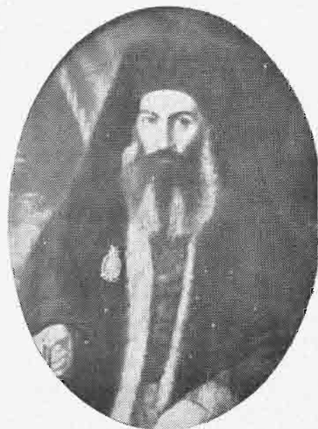
ΔΕΡΚΩΝ ΝΕΟΦΥΤΟΣ, Ο ΑΠΟ ΔΡΑΜΑΣ (1842—1853)