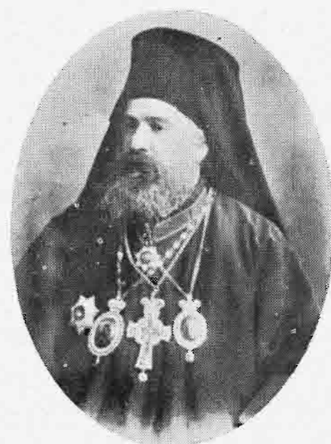
ΔΕΡΚΩΝ ΚΩΝΣΤΑΝΤΙΝΟΣ, Ο ΑΠΟ ΠΡΟΥΣΗΣ (1924)