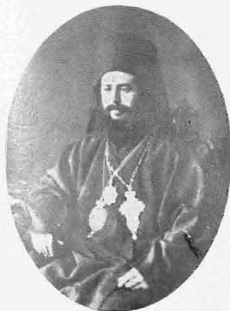
ΔΕΡΚΩΝ ΚΑΛΛΙΝΙΚΟΣ, Ο ΑΠΟ ΘΕΣΣΑΛΟΝΙΚΗΣ (1884—1924)