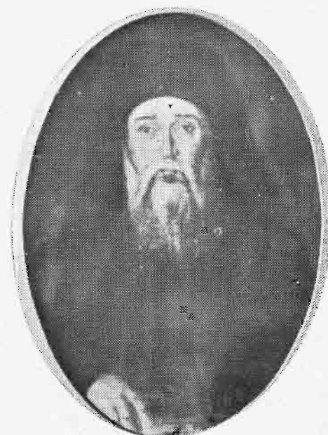
ΔΕΡΚΩΝ ΓΕΡΜΑΝΟΣ, Ο ΑΠΟ ΦΙΛΙΠΠΩΝ ΚΑΙ ΔΡΑΜΑΣ (1835—1842)