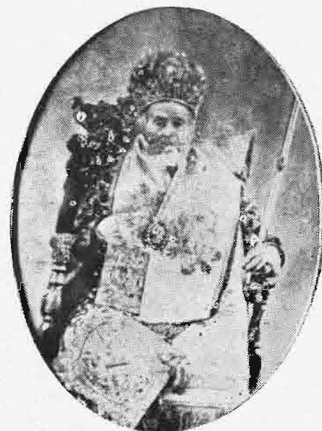
ΔΕΡΚΩΝ ΓΕΡΑΣΙΜΟΣ, Ο ΑΠΟ ΠΕΛΑΓΩΝΕΙΑΣ (1853—1865)