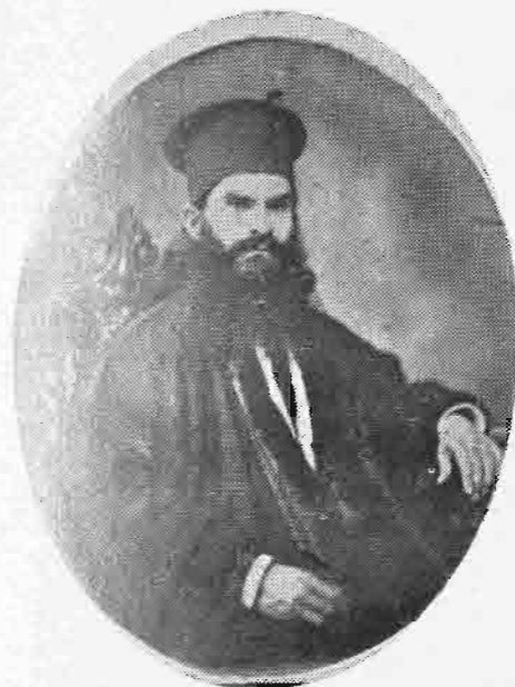
ΔΕΡΚΩΝ ΝΕΟΦΥΤΟΣ, Ο ΑΠΟ ΚΑΣΣΑΝΔΡΕΙΑΣ (1865—1875)