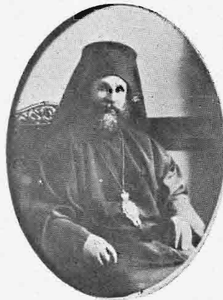
ΔΕΡΚΩΝ ΦΩΤΙΟΣ, Ο ΑΠΟ ΦΙΛΑΔΕΛΦΕΙΑΣ (1925—1929)