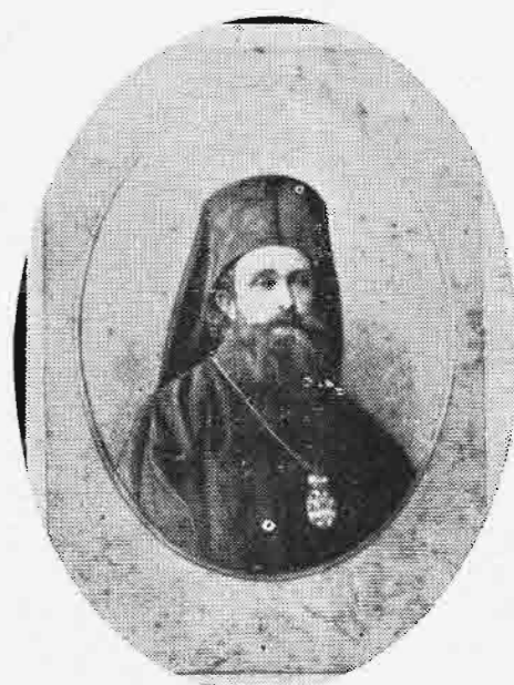
ΔΕΡΚΩΝ ΙΩΑΚΕΙΜ, Ο ΑΠΟ ΛΑΡΙΣΣΗΣ (1875—1884)