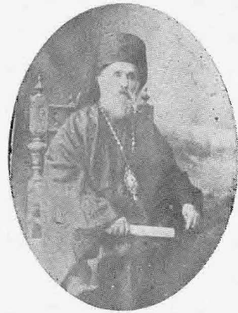
ΔΕΡΚΩΝ ΑΜΒΡΟΣΙΟΣ, Ο ΑΠΟ ΝΕΟΚΑΙΣΑΡΕΙΑΣ (1929—1931)