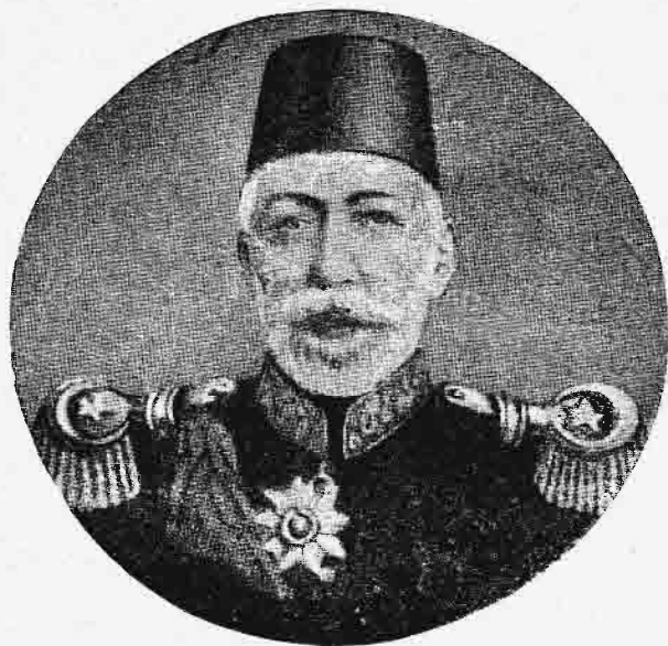
Ὁ σουλτᾶνος Μωάμεθ Ε΄.

Ὁ δὲ νέος σουλτᾶνος ἦτο ἀπλοῦν νευρόσπαστον εἰς τὰς χεῖρας τοῦ κομιτάτου. Περὶ τοῦ κόσμου ἠδύνατο ἐλάχιστα μόνον νὰ γινώσκη, ἐπειδὴ εἶχε περιορισθῆ ὑπὸ τοῦ ἀδελφοῦ ἐντὸς τοῦ χρυσοῦ κλωβοῦ τῶν ἀνακτόρων, καὶ λέγεται περὶ αὐτοῦ, ὅτι ἐδήλωσεν, «ὅτι