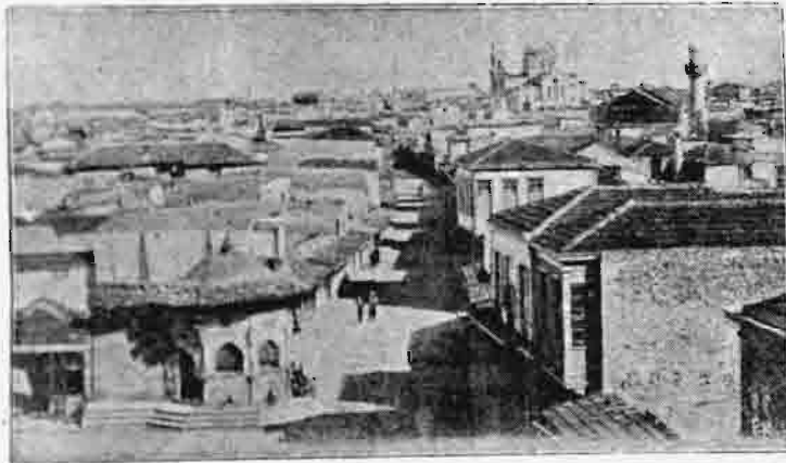
Τὸ Ἡράκλειον ἐν Κρήτῃ.

μενον νὰ παραβλάψῃ τὸ νέον ἐν Τουρκίᾳ καθεστῶς» 1 , ὁ δὲ Ἴταλὸς ὑπουργὸς τῶν ἐξωτερικῶν ἐξεφράζετο διὰ μακροτέρων, ὅτι «ἄνευ τῆς συναινέσεως ἀπασῶν τῶν δυνάμεων δὲν δύναται νὰ ληφθῇ ὑπ' ὄψιν μεταβολὴ τῆς πολιτικῆς καταστάσεως τῆς Κρήτης». Ἄλλ' αἱ δύο μάλιστα ἀντιδραστικαὶ τῶν δυνάμεων, ἡ Αὐστρία καὶ ἡ Γερμανία, ἦσαν ἔτοιμοι νὰ ὑποστηρίξωσι τὴν ἔνωσιν, ἂν ἄλλο τι κράτος ἠθέλην ἀναλάβει τὴν πρωτοβουλίαν 2 . Ὅτε δ' ἔγεινε τῇ 15 Ὀκτωβρίου ἡ ἐπίσημος ἀνακοίνωσις τῶν τεσσάρων προστατίδων δυνάμεων, τὸ ὕψος αὐτῆς ἠδὲ χαρίστηκε τοῖς τ' ἐν Χανίοις καὶ τοῖς ἐν Ἀθήναις. Αἱ δυνάμεις ἐθεώρουν μὲν τὴν ἔνωσιν ἐξαρτωμένην ἐκ τῆς συναινε-