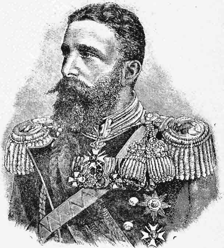
Ἄλεξανδρος Α' ἡγεμὼν Βουλγαρίας.

θετῆ πατρίδι. Καὶ δὴ εἶχε συμμετάσχει τοῦ ῥωσοτουρκικοῦ πολέμου, εἶχε διαβῆ τὸν Δούναβιν ἐν Σβιστόβω καὶ τὸν Αἴμον μετὰ τοῦ Γούρκου· εἶχεν ἀγωνισθῆ ἐν Νέα Ζαγορά καὶ παραστῆ ἐν ταῖς πρὸ τῆς Πλεύνας τάφροις, ἐν δὲ ταῖς ἡμέραις τῆς ἐκλογῆς αὐτοῦ ὑπηρετεῖ ὡς Πρῶστος ἀνθυπολοχαγὸς ἐν τῷ Πότσδαμ. Ἄλλα, καίτοι ἡ στρατιωτικὴ αὐτοῦ πείρα καὶ οἱ ἀρρενωποὶ καὶ ἀρήιοι αὐτοῦ