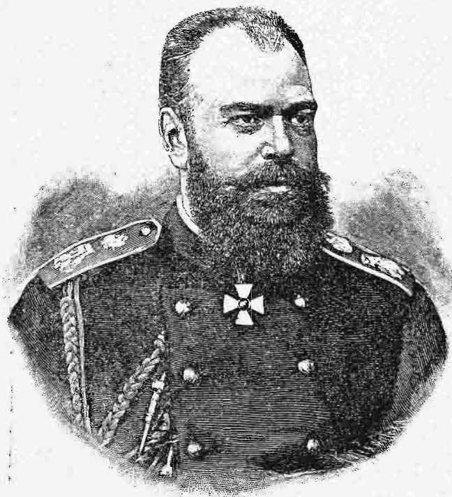
Ἀλέξανδρος Γ' αὐτοκράτωρ Ῥωσίας.

Πρὸς γενικὴν δ' ἐκπληξιν ὁ σουλτᾶνος ἠρέσθη εἰς διαμαρτυρίας καὶ ἀπλῶς ἀμυντικὰς παρασκευὰς, διστάζων μεταξὺ τοῦ φόβου περιπλοκῶν ἐν Ἀλβανίᾳ καὶ Μακεδονίᾳ καὶ τῆς μερίμνης μὴ προσβάλλῃ τοὺς Μωαμεθανούς. Αἱ δὲ δυνάμεις, ἰδίως δὲ ἡ Ῥωσία, προσποιήθησαν μὲν, ὅτι ἐσκανδαλίσθησαν ἐπὶ τῇ οὕτω θρα-