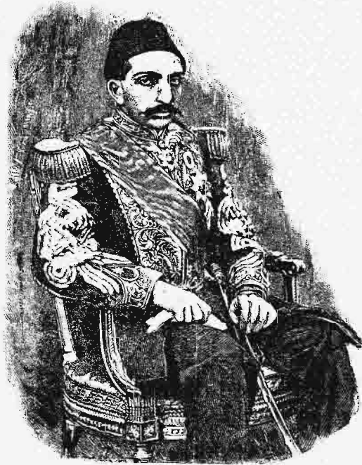
Ἀβδούλ Χαμίτ Β΄.

φατρία, δυσηρεστημένη ἔνεκα τῆς ἀδυναμίας τοῦ φιλορώσου μεγάλου βεζύρη, ἤγειρε τὴν κραυγὴν «Ἡ Τουρκία χάριν τῶν Τούρκων· χιλιάδες δὲ τινες σοφτάδων, ἦτοι σπουδαστῶν τῆς θεολογίας, ἠνάγκασαν τὸν σουλτᾶνον νάποπέμψῃ τὸν πρωθυπουργόν. Ὁ ἀγγλικὸς στόλος κατέπλευσεν εἰς τὰ Μπεζίκια, καὶ τῇ 17 Μαΐου ὁ νέος μέγας βεζύρης καὶ οἱ ὁμόφρονες αὐτοῦ, τυχόντες παρὰ τοῦ σεΐχουλισλάμη φετῶ, παρέχοντος εἰς αὐτοὺς τὸ δικαίωμα νὰ καταλύσωσι τὸν Ἀβδούλ Ἀζίζ ἔνεκα τῆς ἀνικανότητος καὶ τῆς ἀκρατείας αὐτοῦ, ἐκήρυξαν τὸν θρόνον κενόν, καὶ τὴν ὑστεραίαν ἀνεκήρυξαν σουλτᾶ-