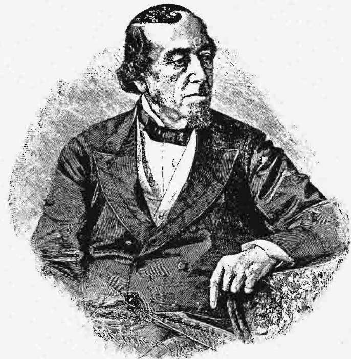
Λόρδος Μπήκονσφηλδ (Δισραέλης).

Ἡ δ' εὐρωπαϊκὴ διπλωματία δὲν ἔμεινεν ἄεργος καθ' ὃν χρόνον διήρουν αἱ μετὰ τῆς Τουρκίας σπονδαὶ τῆς Σερβίας καὶ τοῦ Μαυροβουνίου. Καίτοι δ' ὁ ἀγγλικὸς στόλος ἐπέμφθη εἰς τὰ Μπεζίκια καὶ ὁ λόρδος Μπήκονσφηλδ εἶχεν ἐκφωνήσῃ λόγον πολεμικὸν, ὁ λόρδος Σώλσβαρου, ὁ ἥκιστα φιλοπόλεμος τῶν Ἀγγλων συντηρητικῶν πολιτευτῶν, ἀπεστάλη, ὅπως ἀντιπροσωπεύσῃ τὴν Μεγάλην Βρετανίαν καὶ μετατρέψῃ τὴν φιλότουρκον στάσιν τοῦ πρεσβευτοῦ αὐτῆς ἐν συνδιασκέψει τῶν δυνάμεων, σκοπούσῃ τὴν διαρρύθμισιν τοῦ ἀνατολικοῦ ζητήματος καὶ συνελθούσῃ ἐν Κωνσταντινουπόλει τὸν Δεκέμβριον. Αἱ δὲ δοθεῖσαι εἰς τὸν Σώλσβαρου ὁδηγίαι ἦσαν νὰ τηρήσῃ ὡς βάσιν τὴν ἀκεραιότητα τῆς Τουρκίας, νὰ πειραθῆ, ὅπως ἐπιτύχῃ χάριν τῆς Βοσνίας, τῆς Ἑρζεγοβίνης καὶ τῆς Βουλγαρίας τοιαύτην τοπικὴν αὐτονομίαν, ὥστε νὰ δύναται νὰ παρέχῃται εἰς τοὺς ἐγκατοίκους τῶν χωρῶν ἐκείνων ἐγγύησις τις περὶ τῶν συμφερόντων αὐτῶν, νὰ διατηρήσῃ ἐν Σερβίᾳ τὸ καθεστῶς (status quo)