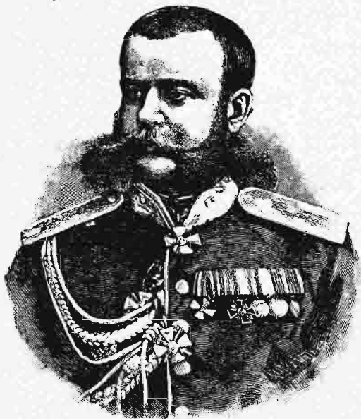
Ὁ στρατηγὸς Σκομπέλεφ.

ἐπιθέσεως ἐναντίον τῆς πρωτευούσης κατώρθωσε νὰ τρέψη τὴν ἐνεργειαν αὐτοῦ εἰς τὴν ἐπίπονον πολιορκίαν τοῦ Νίξιτς, ὅπερ τέλος παρεδόθη τῇ 27 Αὐγούστου, ἀφ' οὗ εἶχε πρότερον ἀποκλεισθῆ σχεδὸν συνεχῶς ὑπὸ ἐπαναστατῶν ἢ Μαυροβουνίων πάντοτε ἀπὸ τῆς ἐνάρεως τῆς ἐπαναστάσεως τῆς Ἑρζεγοβίνης. Τὸ φρούριον τοῦ Μπίλεκ ταχέως ἀνεπέτασε τὴν λευκὴν σημαίαν, οὕτω δ' οἱ Μαυροβούνιοι κατέκτησαν ἄξιον λόγου μέρος τῆς Ἑρζεγοβίνης. Ἄλλ' ἢ Αὐστρία καὶ αἱ φθινοπωριναὶ βροχαὶ παρεκώλυσαν προχώρησιν αὐτῶν εἰς τὴν Τρεβίνγιε καὶ τὸ Μοστάρ. Οὕτω δ' οἱ Μαυροβούνιοι,