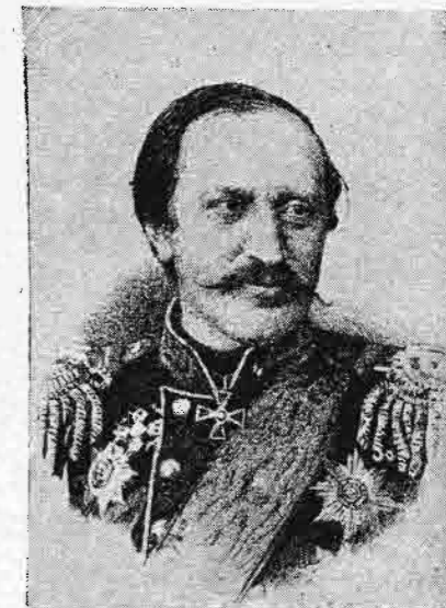
Ἰγνάτιεφ πρεσβευτῆς τῆς Ῥωσίας ἐν Κωνσταντινουπόλει.