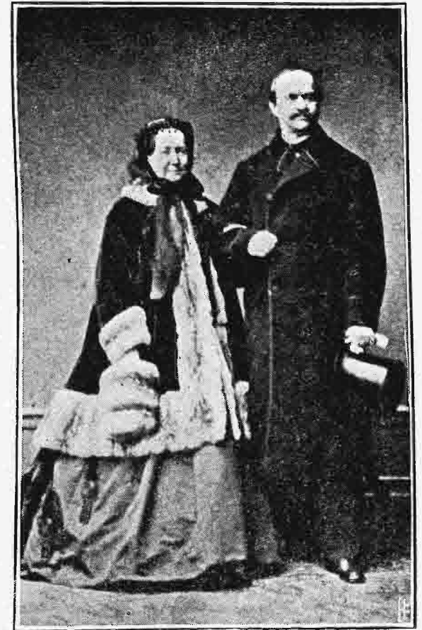
Ὄθων καὶ Ἀμαλία ἐν Βαυαρίᾳ.

Ἐν ᾧ δὲ περιεπάτει μετὰ τῆς μνηστῆς καὶ τῆς μητρὸς αὐτῆς Ἀγκας ἐν τῷ ἄλσει τοῦ Topchtider τῇ 29 Μαΐου 1868, ὅπου πρὸ τριῶν ἐτῶν εἶχε πανηγυρίσει τὴν ἐπέτειον τῆς νίκης τοῦ Τακόβου, τρεῖς ἄνδρες ἐπυροβόλησαν αὐτὸν καὶ τὰς μετ' αὐτοῦ κυρίας. Καὶ ὁ μὲν Μιχαήλ ἔπεσε νεκρὸς εἰς τὴν γῆν, ἢ δὲ Ἀγκα ἐφονεύθη καὶ ἢ θυγάτηρ αὐτῆς ἐτραυματίσθη. Ἄλλ' οἱ φονεῖς, δεσμῶται τῆς γείτονος φυλακῆς, ἦσαν ἀπλῶς τὰ ὄργανα ἰσχυροτέρων ἠθικῶν αὐτουργῶν. Καὶ ἢ μὲν κοινὴ γνώμη ὑπέλαβε τὸν οἶκον τοῦ Καραγεώργιβιτς ὡς ὑπεύθυνον ἐπὶ τῷ θηριώδει ἐκείνῳ φόνῳ τοῦ ἀρίστου τῶν ἡγεμόνων, ὃν ἔσχε ποτὲ ἢ Σερβία· ὁ δὲ δημόσιος κατήγορος κατήγγειλε τὸν Ἀλέξανδρον, καὶ οἱ πολιτευταὶ τὴν φιλοδοξωτέραν αὐτοῦ σύζυγον Περσίδαν, ἐνεργοῦσαν, καθ' ἃ ὑπετέθη, ἐν τῷ συμφέροντι τοῦ υἱοῦ Πέτρου, τοῦ νῦν βασιλέως τῆς Σερβίας. Ἄλλοι δ' ἐπίστευσαν, ὅτι τὸν φόνον ἐσχεδιάσεν ὁ Ῥαδοβάνοβιτς, ὁ διευθυντῆς τῶν ὑποθέσεων τοῦ Ἀλεξάνδρου ἐν Βελιγραδίῳ, προσδοκῶν, ὅτι διὰ συμβολαίου, συνταχθέντος ὑπ' αὐτοῦ καὶ ὑπογραφέντος ὑπὸ τοῦ ἡγεμόνος Πέτρου, ἔμελλε νὰ γείνη ἰσχυρὸς, προστατευόμενος ὑπὸ τοῦ νεαροῦ