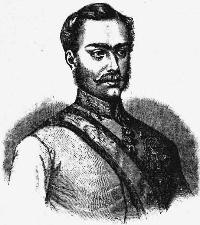
Φραγκῖσκος Ἰωσήφ Α' αὐτοκράτωρ τῆς Αὐστρίας.

αρθήσεως τῆς ῥωμανικῆς Μπουκοβίνας. Ἀλλ' ἡ πρᾶξις αὕτη δυσηρέστησε τὴν τε Πύλην, ἣτις ἠρνήθη τὴν ἀναγνώρισιν τῆς ἀξιώσεως τοῦ ὑποτελοῦς ἡγεμόνος περὶ συνομολογήσεως διεθνῶν συνθηκῶν, καὶ τὸν συνασπισμὸν τῶν ἡγετῶν τῆς ἀντιπολιτεύσεως, ὧν τινες μὲν ἦσαν βίαιοι ἀντίπαλοι τῆς Αὐστρίας καὶ Οὐγγαρίας, πάντες δὲ διψαλέοι ἐρασταὶ τῆς ἀρχῆς μετὰ πενταετῆ ἀποχὴν ἀπ' αὐτῆς. Ἐκ νέου τότε προσεβλήθη ὁ θρόνος, καὶ ἐφέρετο ἡ φήμη τοῦ ὀνόματος συνταγματάρχου τινὸς Νταβί-