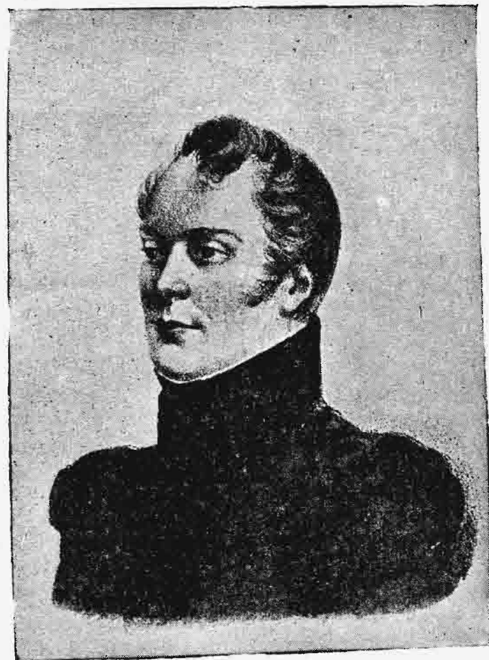
Ὁ ἐν Ναβαρρίνῳ Ῥώσος ναύαρχος Χαῦδεν (Ἴδε σελ. 128).

συνωμοσία, εἰς ἣν ἦσαν ἀναμειγμένοι ὁ Γεώργιος Πέτροβιτς καὶ ὁ Πέρος, καὶ ὁ ὑπὲρ τοῦ πολέμου σάλος ἀπέβη ὄξυς, ὅτε οἱ Τοῦρκοι συνεκέντρωσαν στρατὸν κατὰ μῆκος τῶν συνόρων τῆς Ἐρζεγοβίνης, προκαλοῦντες οὕτω τοὺς φιλοπολέμους ὄρεινους. Καί τινες μὲν ἐπέμενον εἰς ἐπίθεσιν ἐναντίον τοῦ Ἀντιβάρεως, ἄλλοι δ' ἐπέ-