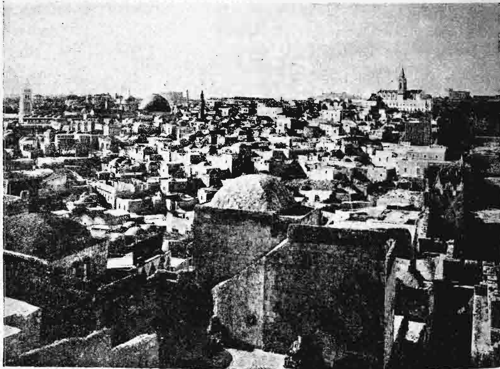
Ἀποψὶς τῆς Ἱερουσαλήμ ἀπὸ βορρᾶ.

ἠνωχλοῦντο ἐν τῇ ὑπ' αὐτῶν κατοχῇ τῆς ἐν Ἱεροσολύμοις ἐκκλησίας τοῦ Παναγίου τάφου καὶ ὅτι, ἐν περιπτώσει καθ' ἣν τὰ κτίρια τῶν ἱερῶν τόπων ἐδέοντο ἐπισκευῆς, ἡ ἀπαιτούμενη ἄδεια ὄφειλε νὰ παρέχεται ἐπὶ τῇ αἰτήσει τοῦ Γάλλου πρεσβευτοῦ. Τὰ δ' ἐξαίρετα ταῦτα προνόμια τῆς «ἀρχαιοτάτης θυγατρὸς τῆς ἐκκλησίας», ἀπορρέοντα ἐκ περιόδου, καθ' ἣν ἡ ὀρωσικὴ αὐτοκρατορία δὲν εἶχεν ἀκόμη συστῆ, εἶχον ὑπονομευθῆ ὑπὸ τινων φερμανίων, παραχωρη-