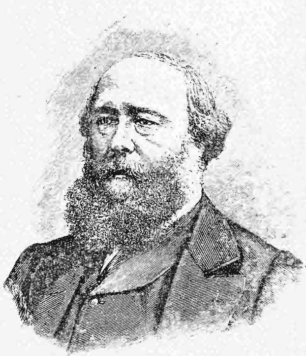
Ὁ λόρδος Σώλσβαρν.

Ἀναμετροῦντες δὲ τὰ κατὰ τὸν πόλεμον τὸν περατωθέντα διὰ τῆς συνθήκης τῶν Παρισίων, δικαιούμεθα νὰ ἐρωτήσωμεν ἡμᾶς αὐτοὺς, ἂν τὸ κέρδος ὑπῆρξε διὰ τὴν Ἀγγλίαν τοιοῦτον, ὥστε νὰπο-