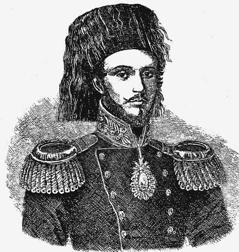
Ὁ σουλτᾶνος Ἀβδουὺλ Μετζίτ.

πολλοὺς τῶν εἰς τὴν πόλιν ἐκ τῆς Τουρκίας μεταναστευσάντων προσφύγων. Πολλοὶ τῶν κατοίκων ἔφυγον· αἱ ὁδοὶ ἦσαν ἔρημοι· καὶ αὐτὰ τὰ πολιτικὰ ἐσίγησαν· οὐδεὶς ἄλλος ἤχος ἠκούετο ἢ ὁ τῶν ἀμαξίων τῶν μεταφερόντων τοὺς χολεροβλήτους εἰς τὰ νοσοκομεῖα, τοὺς νεκροὺς εἰς τοὺς λάκκους, ὅπου ἐθάπτοντο οἱ ἐκ τῆς ἐπιδημίας ἀποθνήσκοντες, τοὺς ἐπιζῶντας εἰς τὴν ὑπαιθρον χώραν ἢ εἰς τὸ πέλαγος. Ἀλλ' ἐν μέσῳ τοῦ καθολικοῦ πανικοῦ ὁ βασιλεὺς καὶ ἡ