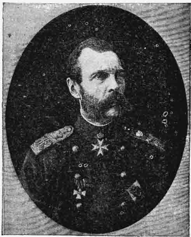
Ἀλέξανδρος Β' αὐτοκράτωρ Ῥωσίας.

δι' ἀπωλείας γοητείας, νάποκρούση πᾶσαν ἐλάττωσιν τοῦ ῥωσικοῦ στόλου τοῦ Εὐξείνου, διὰ δὲ τῆς ἀπαντήσεως ταύτης αἱ περὶ εἰρήνης διαπραγματεύσεις ἔληξαν κατ' οὐσίαν. Αὐστριακὴ δὲ πρότασις περὶ ἐγκαταστάσεως συλλογικῆς προστασίας τῆς ὀθωμανικῆς αυτοκρατορίας, συστήματος ἰσορροπίας ἐν τῷ Εὐξείνῳ καὶ τοῦ ἐν αὐτῷ περιορισμοῦ τοῦ ῥωσικοῦ στόλου εἰς ἀριθμὸν πλοίων ἀντίστοιχον πρὸς τὰ διατηρούμενα πρὸ τοῦ πολέμου, ἔγινε μὲν δεκτὴ ὑπὸ τοῦ