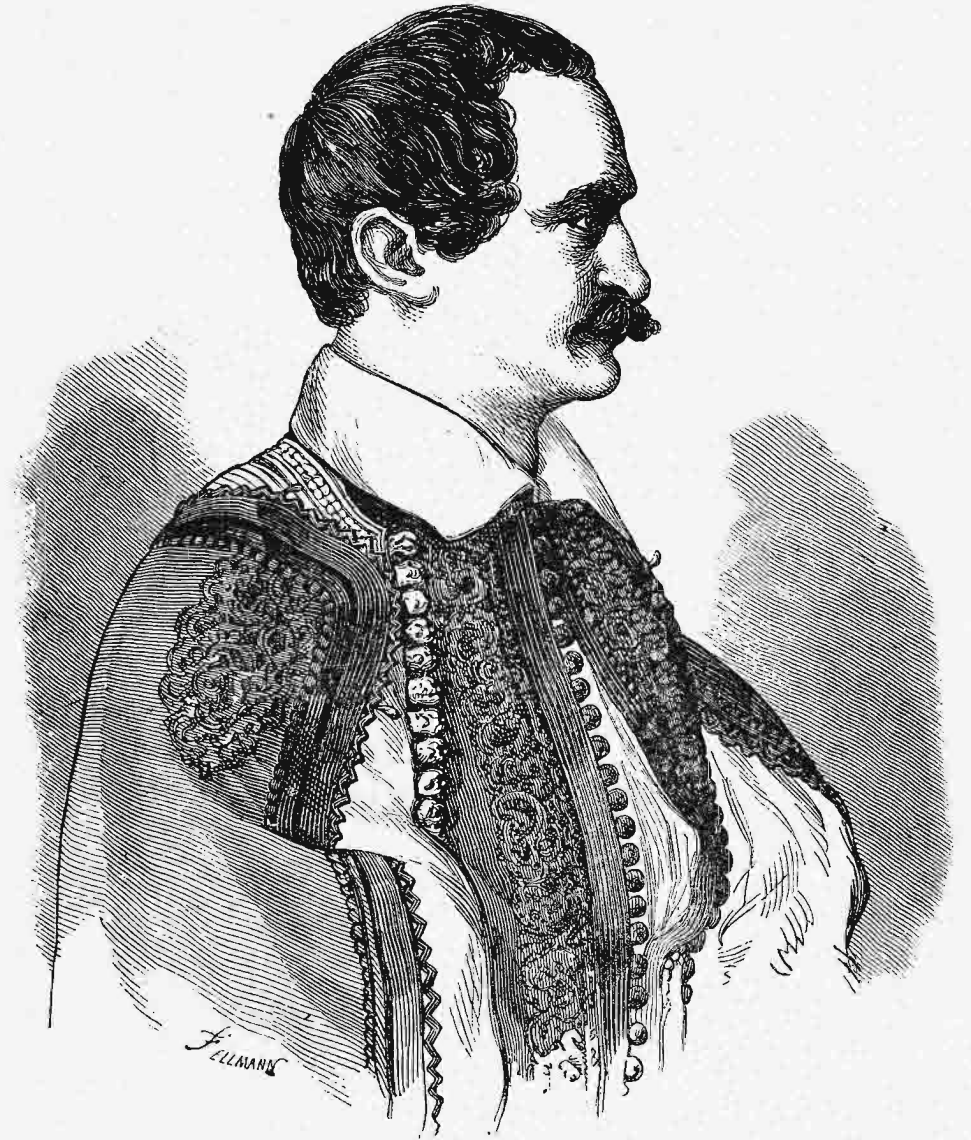
Ὁ βασιλεὺς Ὁθων.

κάλυπτον προστασίαν τῆς βασίλισσας χάριν ἐπαναστάσεως κατὰ τὴν ἄνοιξιν. Ἐξ ἑτέρου δὲ, ὅτε ἦλθεν ὁ χρόνος τῆς προσδοκωμένης ἀποστασίας, ἱκανοὶ Ἕλληνες ἀξιωματικοὶ παρητήθησαν, ὅπως ἐνωθῶσι μετὰ τῶν συμμαχιῶν κατὰ τὰ σύνορα· μεταξὺ δὲ τούτων ἦσαν οἱ