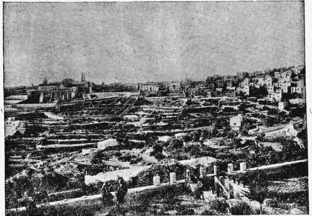
Πανόραμα τῆς Βηθλεέμ.

Γάλλων καθολικῶν ἐθεωρήθη οὐσιώδης ὑπ' αὐτοῦ. Ἐν τε Ῥώμῃ καὶ ἐν Ἱεροσολύμοις ἀνεδείχθη ὡς ὁ ὑπέρμαχος τοῦ ἀγῶνος τῆς καθολικῆς ἐκκλησίας καὶ ἔδωκεν εἰς τὸν ἐν Κωνσταντινουπόλει πρεσβευτὴν τῆς Γαλλίας ὁδηγίαν νὰ ἐπιμείνη εἰς τὴν αὐστηρὰν ἐκτέλεσιν τῶν διομολογήσεων τοῦ 1740, οὕτω «καθιστάνων τὸν τάφον τοῦ Χριστοῦ ἀφορμὴν ἔριδος μεταξὺ Χριστιανῶν» κατὰ τὴν ἔκφρασιν τοῦ Ἄγγλου ὑπουργοῦ τῶν ἐξωτερικῶν. Ἡ δὲ Πύλη, περιελ-