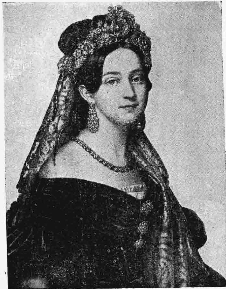
Ἡ βασίλισσα Ἀμαλία.

εἰς τοὺς διπλωμάτας, εἶχεν ἀποβάλει τὴν ἐκ τοῦ πλησίον ἄμεσον γνῶσιν τῶν κατὰ τὴν ἰδίαν ἑαυτοῦ χώραν. Ἀπὸ δεκαετίας ὅλης μὴ ὑπηρετήσας ἐν Ἑλλάδι, ἐπέστρεψεν αὐτὸς ἔχων τὴν ἄχαριν ἐντολὴν νὰ ἐκτελέσῃ πρόγραμμα ἀντιδημοτικόν, ἐπιβεβλημένον εἰς τὴν αὐλὴν