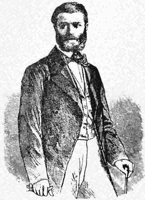
Μιχαὴλ Ὁβρένοβιτς ἡγεμῶν τῆς Σερβίας.

τὴν φήμην, ὅτι εἰς τὸ ἐξῆς ἔμελλον νὰ ἔχωσι δεκαεπτὰ κυρίους ἀνθ' ἑνός. Ἄλλ' ἡ γερουσία διέταξε τὸν ἐχθρὸν αὐτοῦ Βοῦτσιτς νὰ καταστείλῃ τὴν ἀποστασίαν ἐκείνην· ὁ δὲ θριαμβεύων ἡγέτης, ἐπιστρέψας εἰς τὸ Βελιγράδιον, ἀνῆλθεν εἰς τὴν οἰκίαν τοῦ ἡγεμόνος, καὶ ἐδήλωσεν εἰς αὐτὸν σαφῶς, ὅτι τὸ ἔθνος δὲν εἶχε πλέον ἀνάγκην αὐτοῦ. Καὶ τῇ μὲν 1 Ἰουνίου 1839 ὁ δεύτερος ἰδρυτὴς τῆς νέας Σερβίας παρητήθη ὑπὲρ τοῦ ἀσθενοῦς πρεσβυτέρου υἱοῦ Μιλάνου Ὁβρένοβιτς Β', καὶ ἔφυγε πέραν τοῦ ποταμοῦ Σάου. Τῇ δὲ 27 Ἰουνίου ἀπέθανεν ὁ Μιλᾶνος πρὶν ἢ κἂν μάθῃ, ὅτι εἶχεν ὑπάρξει ἡγεμῶν τῆς Σερβίας. Ἐν τούτῳ δὲ τῷ μεταξὺ ἐξηκολούθησαν διοικοῦντες τὴν χώραν ὁ Βοῦτσιτς, ὁ Ἐφραὶμ Ὁβρένοβιτς καὶ ὁ τουρκόφιλος Πετρόνιεβιτς.