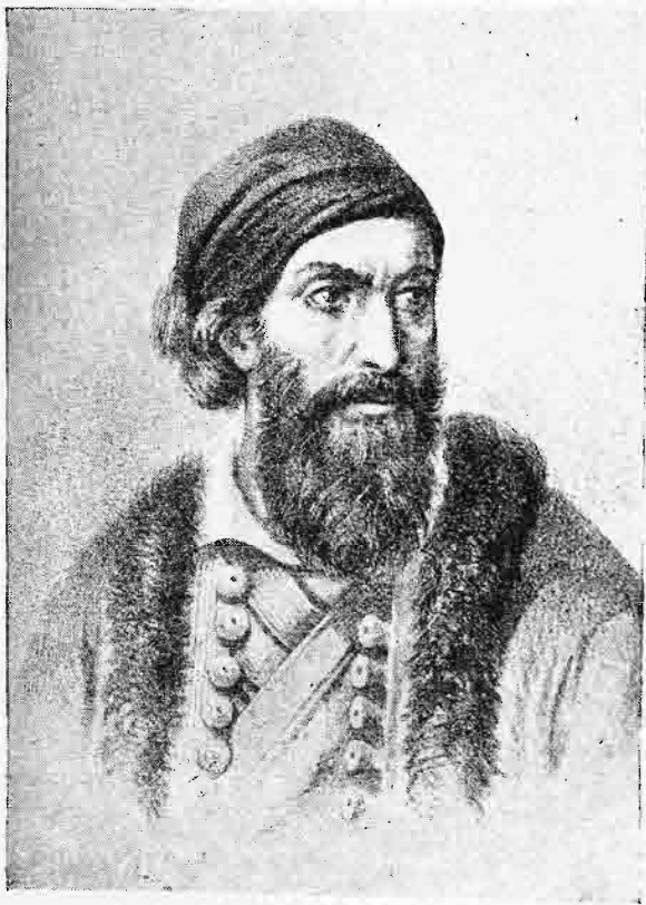
Παπαφλέσσας (Ἴδε σελ. 118).

Οἱ Ῥωμᾶνοι ἱστορικοὶ χρονολογοῦσι τὴν πρώτην ἀρχὴν τῆς ἐθνικῆς αὐτῶν ἱστορίας ἀπὸ τοῦ 1822. Ἄλλ' ὁ διορισμὸς ἰθαγενῶν