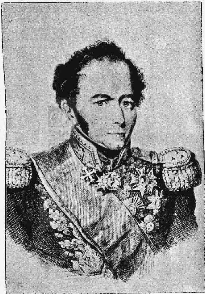
Ὁ ἐν Ναβαρρίνῳ Γάλλος ναύαρχος Δεριγνῦ.

ἀνεξαρτησίαν τῆς Ἑλλάδος, τὴν αὐτονομίαν τῆς Σερβίας, τὴν ἀπώλειαν τοῦ Ἀλγερίου, τὴν ἀποστασίαν τῶν ἐν Βοσνία, Ἀλβανία καὶ Αἰγύπτῳ ὑπηκόων. Εἶχεν ἴδει τὰ ὄψικα σύνορα προχωροῦντα εἰς τὸν Προῦθον, τὴν ὄψικὴν προστασίαν ἐκτεινομένην τὸ μὲν πρῶτον εἰς τοὺς ἰδίους ἑαυτοῦ Ῥωμάνους ὑπηκόους, εἶτα δ' εἰς ἑαυτόν· εἶχεν ὑπογράψει τὰς τρεῖς ταπεινωτικὰς συνθήκας τοῦ Ἀκκερμαν, τῆς Ἀδριανουπόλεως καὶ τοῦ Χουγκιὰρ-Ἰσκελεσῆ. Οὐδ' εἶχον ὑπάρξει πρά-