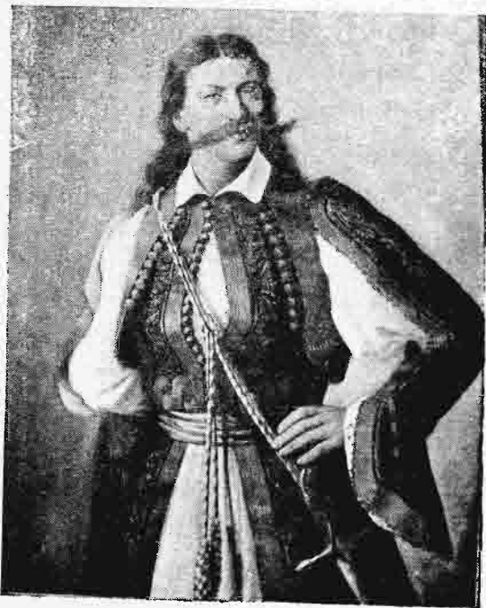
Κωνστ. Μαυρομιχάλης (Ἴδε σελ. 148).

ὑπὸ τοῦ αὐτοκράτορος τῆς Αὐστρίας διαταγὰς ἔτυχε δεξιώσεως εὐλαβεστάτης. Ἄλλ' ἡ διαμονὴ αὐτοῦ πλησιέστατα τῶν συνόρων παρεῖχεν ἀφορμὴν εἰς ταραχὰς, ἐπειδὴ βοσνιακαὶ συμμορίαὶ ἐδήουν διηνεκῶς τὰ σύνορα τῆς αὐστριακῆς αὐτοκρατορίας καὶ τρεῖς ἢ αὐστριακὴ κυβέρνησις εἶχεν ἀναγκασθῆ νὰ τιμωρήσῃ τοὺς δυσπειθεῖς ὑπηκόους τοῦ σουλτάνου. Διὸ ἀφέθη εἰς τὸν Χουσεῖν ἡ ἐκλογή ἢ νὰ διαμείνῃ αὐτόθι ἐπὶ τῷ ὄρω περιορισμοῦ καὶ ἐπιτηρήσεως ἢ νὰ ἐπιστρέψῃ εἰς τὴν Τουρκίαν. Προετίμησε δὲ τὴν εἰς τὴν Τουρκίαν ἐπιστροφὴν, καὶ ἀπέθανεν ἐξόριστος κατὰ τὴν μετάβασιν αὐτοῦ εἰς Τραπεζοῦντα.