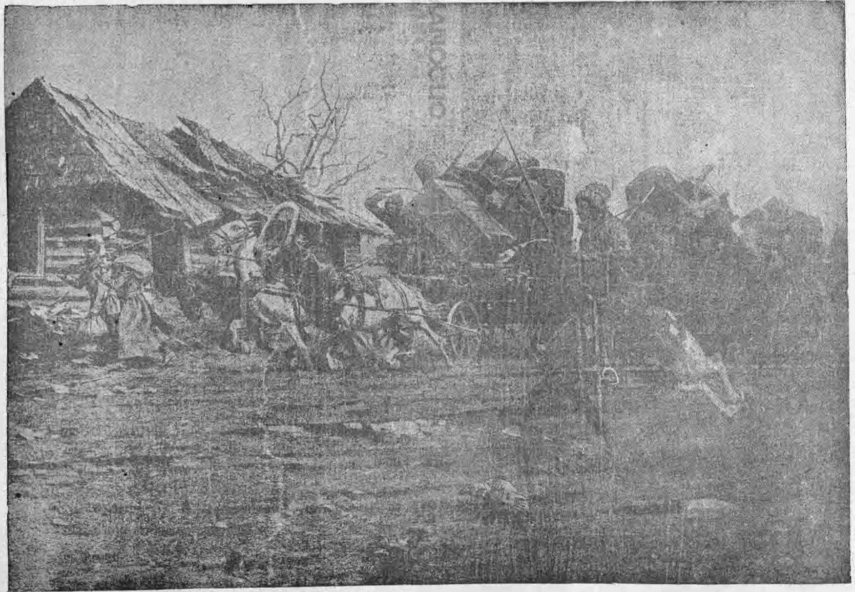
Ἡ φυγὴ τῶν Ρώσων.