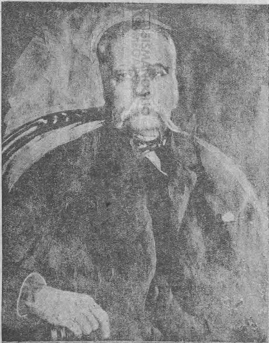
Ο νέος Πρωθυπουργός τῆς Ελλάδος κ. Αλέξανδρος Ζαΐμης.