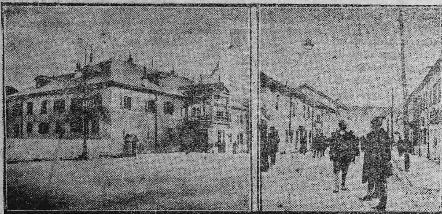
Τὸ ἀνάκτορον τοῦ βασιλέως Νικήτα.