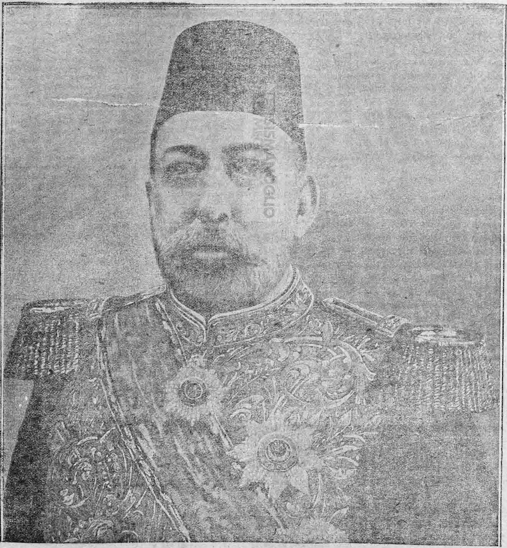
'Η Α. Α. Μ. ὁ Γαζή Σουλτάν Μεχμέτ Ρεσάτ ὁ Ε'.

ΕΠΙ ΤΗ ΙΕΠΕΤΕΙΩ ΤΗΣ ΟΘΩΜΑΝΙΚΗΣ ΑΝΕΞΑΡΤΗΣΙΑΣ