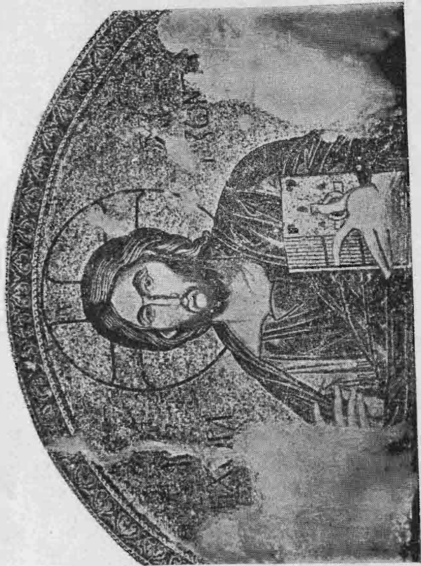
Η ΧΩΡΑ ΤΩΝ ΖΩΝΤΩΝ

Κατὰ ταῦτα λέγει λοιπὸν ὁ Ἅγιος Ἡλιουπόλεως ὅτι αἱ ὡς ἄνω φράσεις δὲν ἀναιροῦσι τὴν ὀνομασίαν τῆς Μονῆς, ὅπως τὴν θέλει ἡ Α. Σεβασμιότης. Ὅσα ὅμως φέρει ὡς δικαιολογητικὰ τοῦ ἰσχυρισμοῦ αὐτοῦ τούτου, εἶναι ὅλα ἀναιρετικὰ τοῦ ἰσχυρισμοῦ του, κατὰ τρόπον λίαν προ-