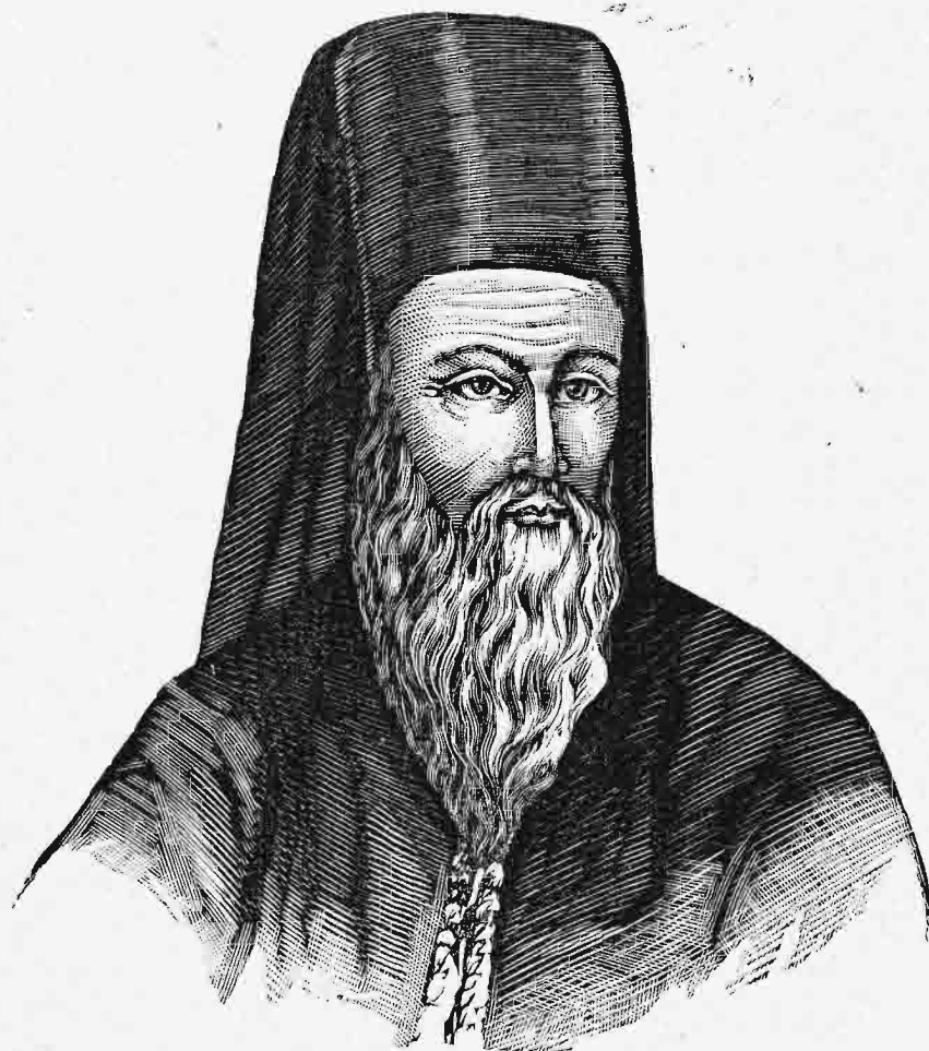
Εἰκὼν Μελετίου 1) .

† Τὴν σεβασμίαν σου γραφὴν πληρεστᾶτην τῆς σῆς καλοκάγαθίας ἔναγχος λαβὼν ὅλως ἐπλήσθην χαρᾶς, τοῦτο μὲν ὅτι εἶδον τοὺς χαρα-