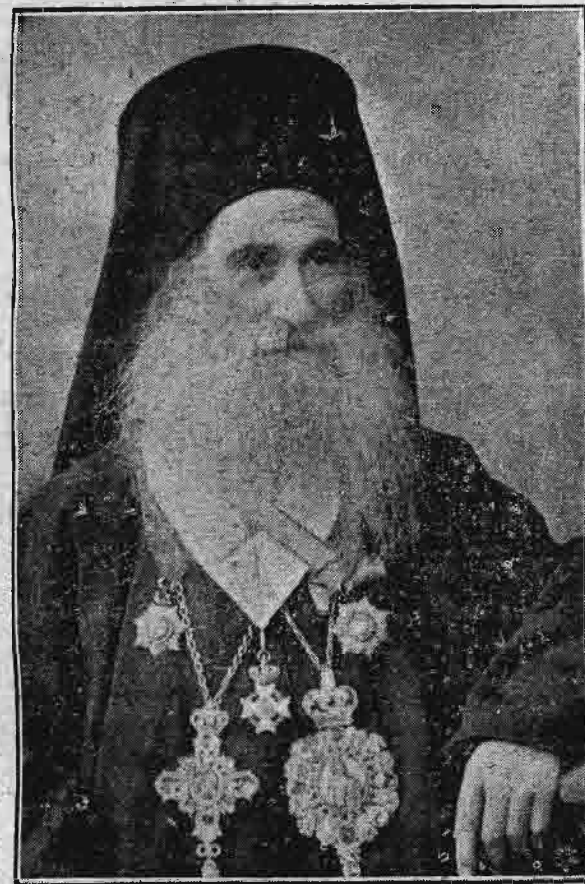
† Η Α. ΣΕΒΑΣΜΙΟΤΗΣ Ο ΜΗΤΡΟΠΟΛΙΤΗΣ ΑΜΑΣΕΙΑΣ ΚΥΡΙΟΣ ΑΝΘΙΜΟΣ ΑΛΕΞΟΥΔΗΣ

Αὐλῶν καὶ κοινῶς Αὐλῶνζ (Valona) πόλις τῆς (εἰτα κλη-