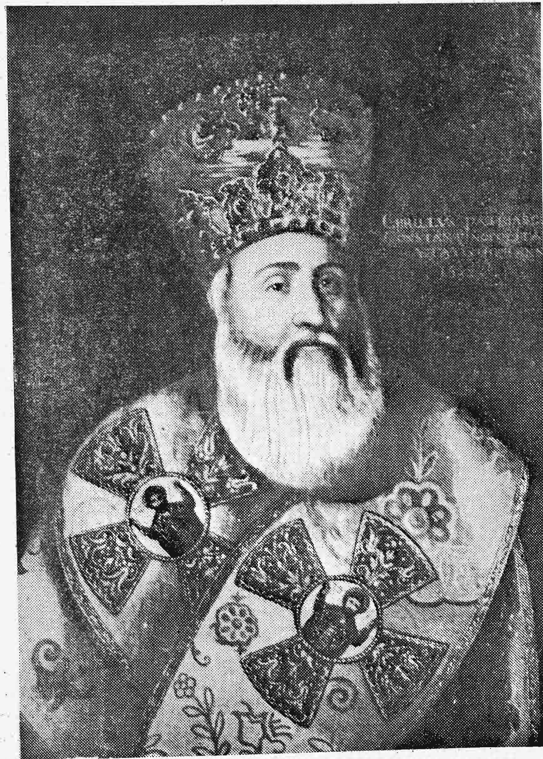
Κύριλλος ὁ Λούκαρις