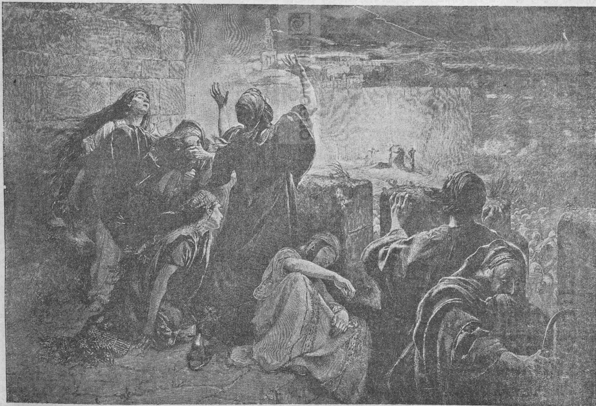
Αι γυναῖκες πρὸ τοῦ Γολγοθᾶ.