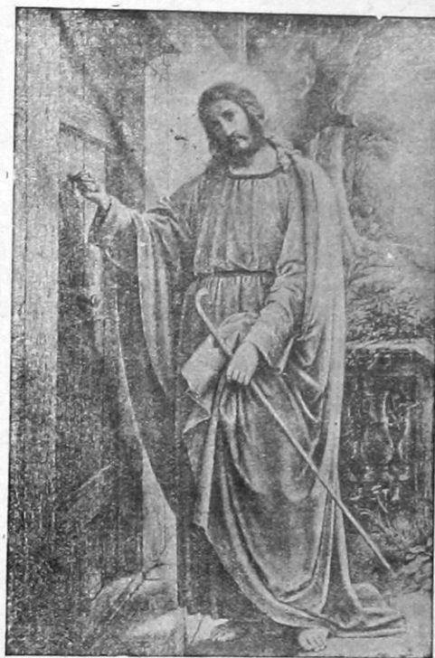
«Ἰδοὺ ἔστηκα ἐπὶ τὴν θύραν καὶ κρούω». (Ἀποκ. 320)

Καὶ νῦν ἀποστρέφομαι πρὸς Ὑμᾶς τοὺς νεαροὺς καὶ φερέλπιδας τελειοφοίτους πάντων τῶν τμημάτων τῆς σχολῆς, οὓς τρίτον τοῦτο ἔτος ἤξιωσέ με ὁ Ὑψιστος νὰ παρακολουθῶ ἐκ τοῦ σύνεγγυς ἐν τῇ ἀγωγῇ καὶ παιδείᾳ καὶ νὰ βλέπω μετ' ἀρρητου χαρᾶς προκόποντας εἰς γνώσιν καὶ ἀρε-