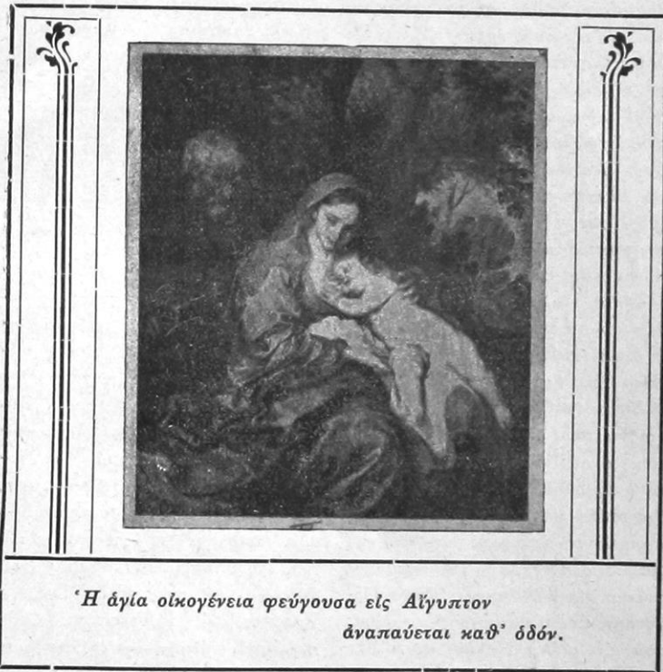
Ἡ ἅγια οἰκογένεια φεύγουσα εἰς Αἴγυπτον ἀναπαύεται καθ' ὁδόν.

«ἐλευθεροφροσύνη» δὲν ἀπαλλάττει τοὺς κ.κ. «ὀρθολογιστὰς» τῶν στοιχειωδεστάτων ὑποχρεώσεων κοινωνικῆς ἂν μὴ τινος ἄλλης εὐπρεπειας. Καὶ πρῶτον μὲν ἀδικεῖ ὁ κ. «ὀρθολογιστῆς» τὴν ἐπιστήμην ἂν νομίζη διὰ «αὐτὴ θέλει ν' ἀντικαταστήσῃ