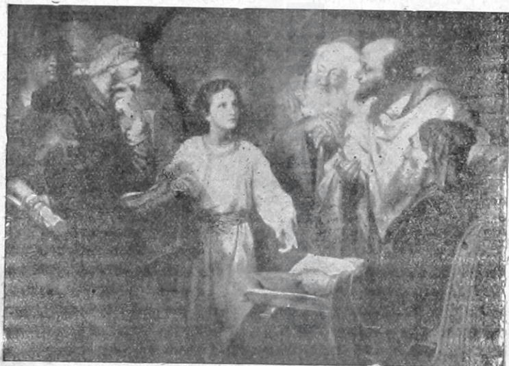
Ὁ Ἰησοῦς δωδεκαετής διδάσκων ἐν τῷ Ναφ.

ΕΤΟΣ Γ'. || ΦΝ ΣΜΥΡΝΗ τῆ 27 'Ιουλίου 1913 || ΑΡΙΘ. 121