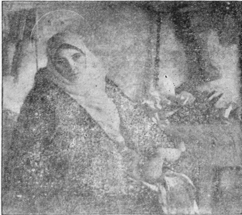
Θεὸς τὸ τεχνέν, ἡ δὲ μήτηρ Παρθένος

σιν μεγάλης τινὸς ἀποστολῆς ἐν τῷ κόσμῳ, βεβαρημένος ὑπὸ τὸ βάρος τῆς εὐθύνης του, κατατρομαγμένος ἐκ τῆς ἰδίας του ἀδυναμίας, ἀγα- πᾶ νὰ κάμπτη πρὸς ἑαυτόν, μα-