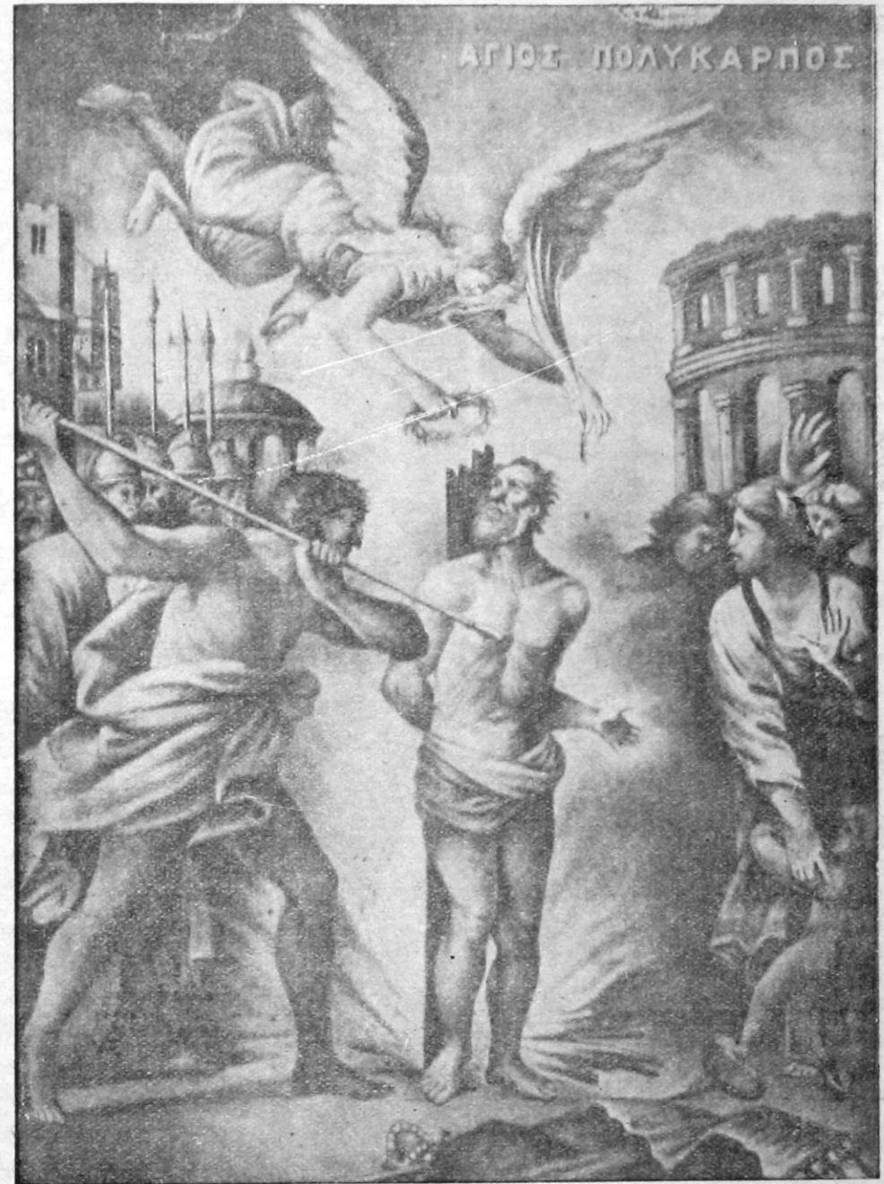
ΤΟ ΜΑΡΤΥΡΙΟΝ ΤΟΥ ΙΕΡΟΥ ΠΟΛΥΚΑΡΠΟΥ