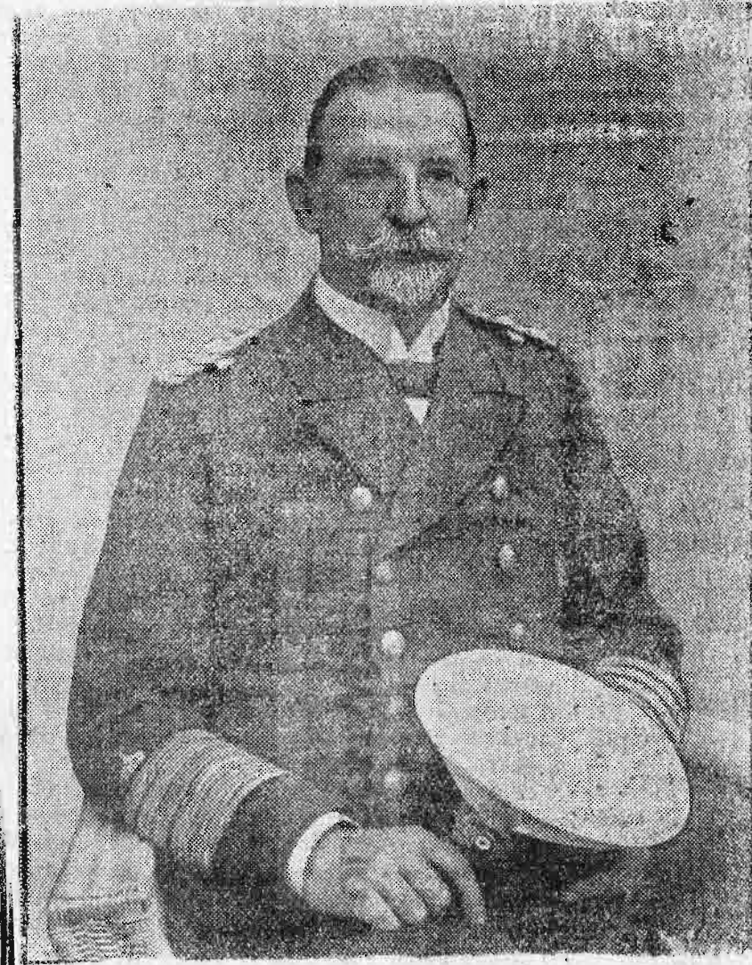
‘Ο ναύαρχος von Capelle, ὑπουργὸς τῶν ναυτικῶν τῆς Γερμανίας.