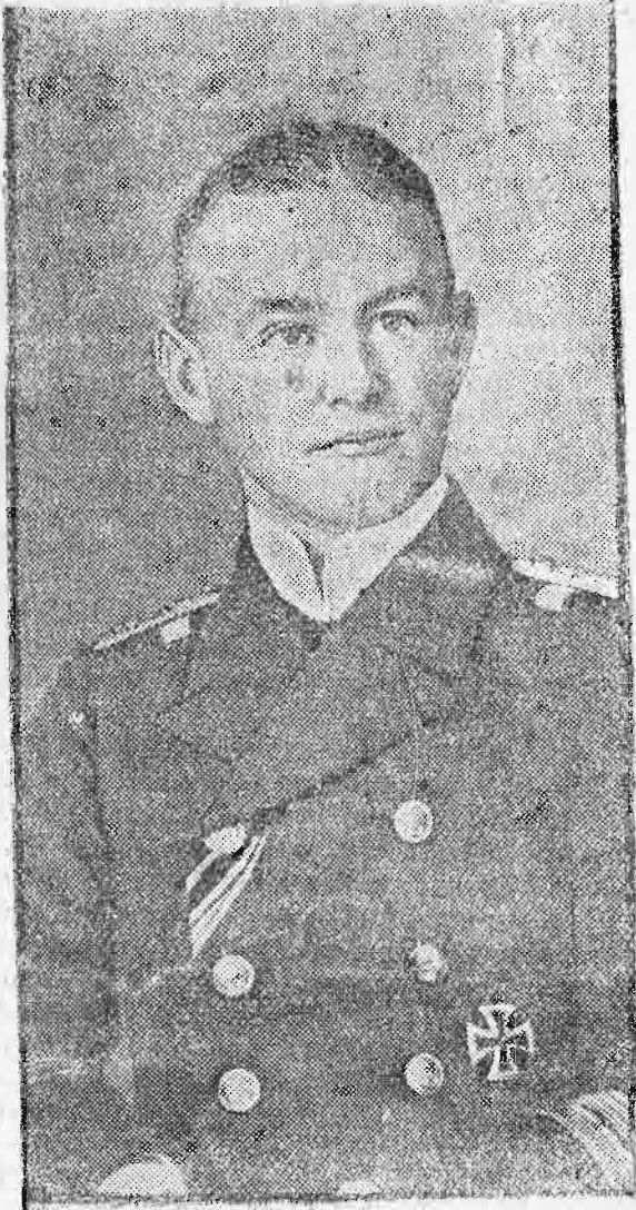
‘Ο πλωτάρχης Konrad Albrecht, ἀρχηγὸς τοῦ γερμανικοῦ τορπιλλικοῦ στόλου.