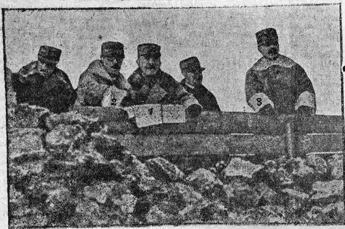
στρατηγὸς Νιβέλ εἰς τὸ ἰταλικὸν μέτωπον. 1) Νιβέλ. 2) Καδὸρνα. 3) Πόρρο.