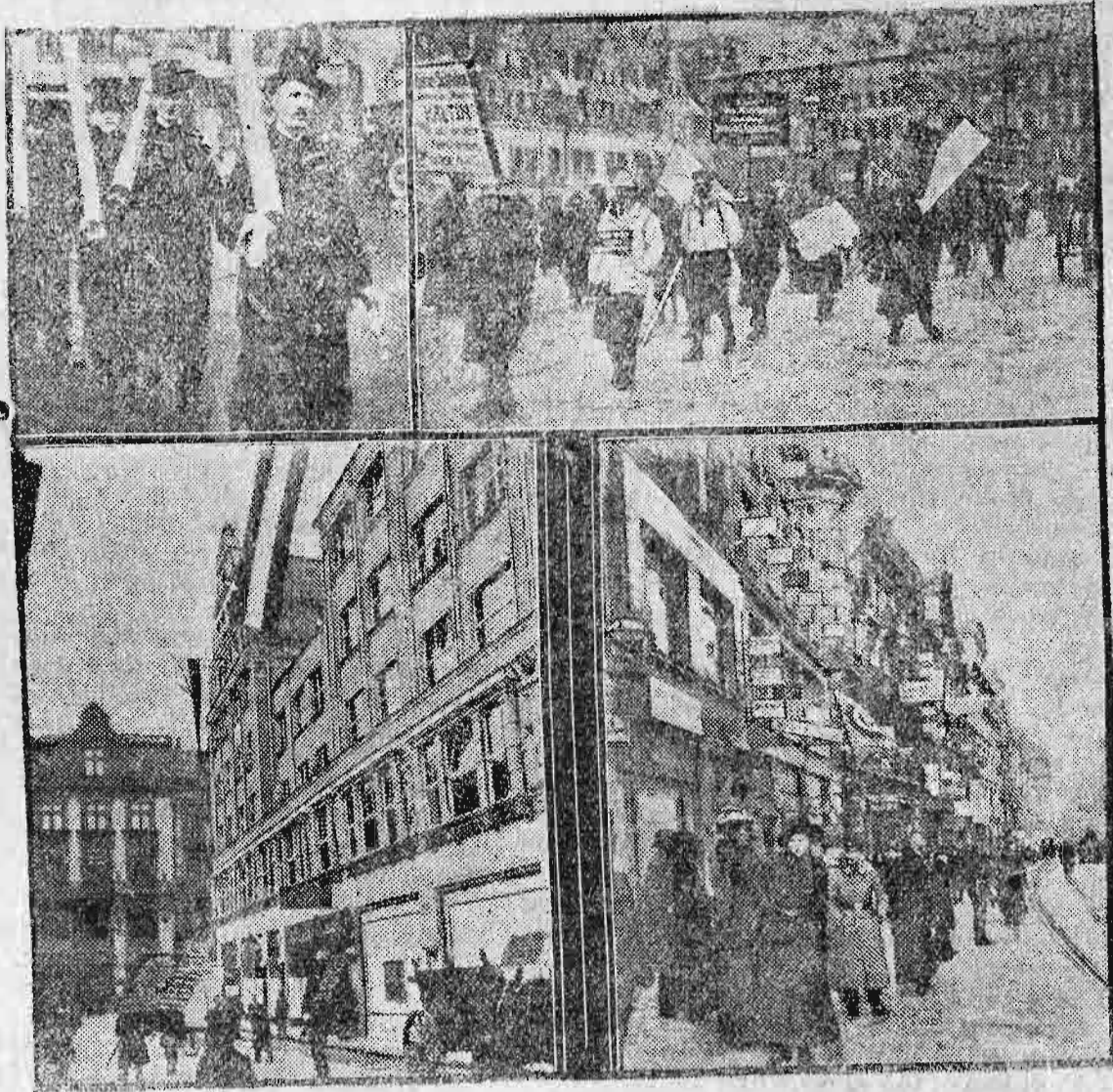
Από την εφειτεινή μεγάλην αγοράν της Δειψίας.