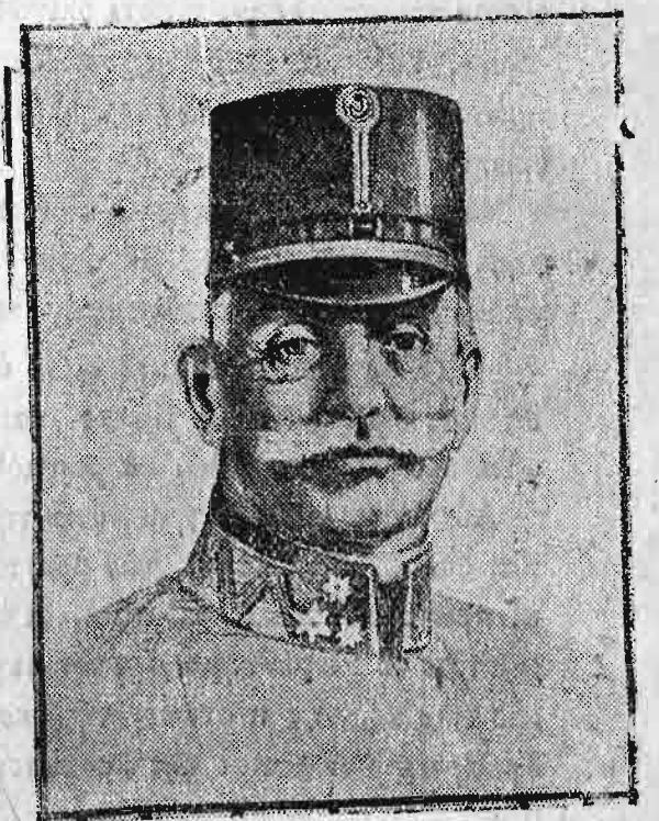
‘Ο τέως ἐπιτελάρχης τοῦ αὐστροουγγρικοῦ στρατοῦ βαρβῶνος von Hotzendorf.