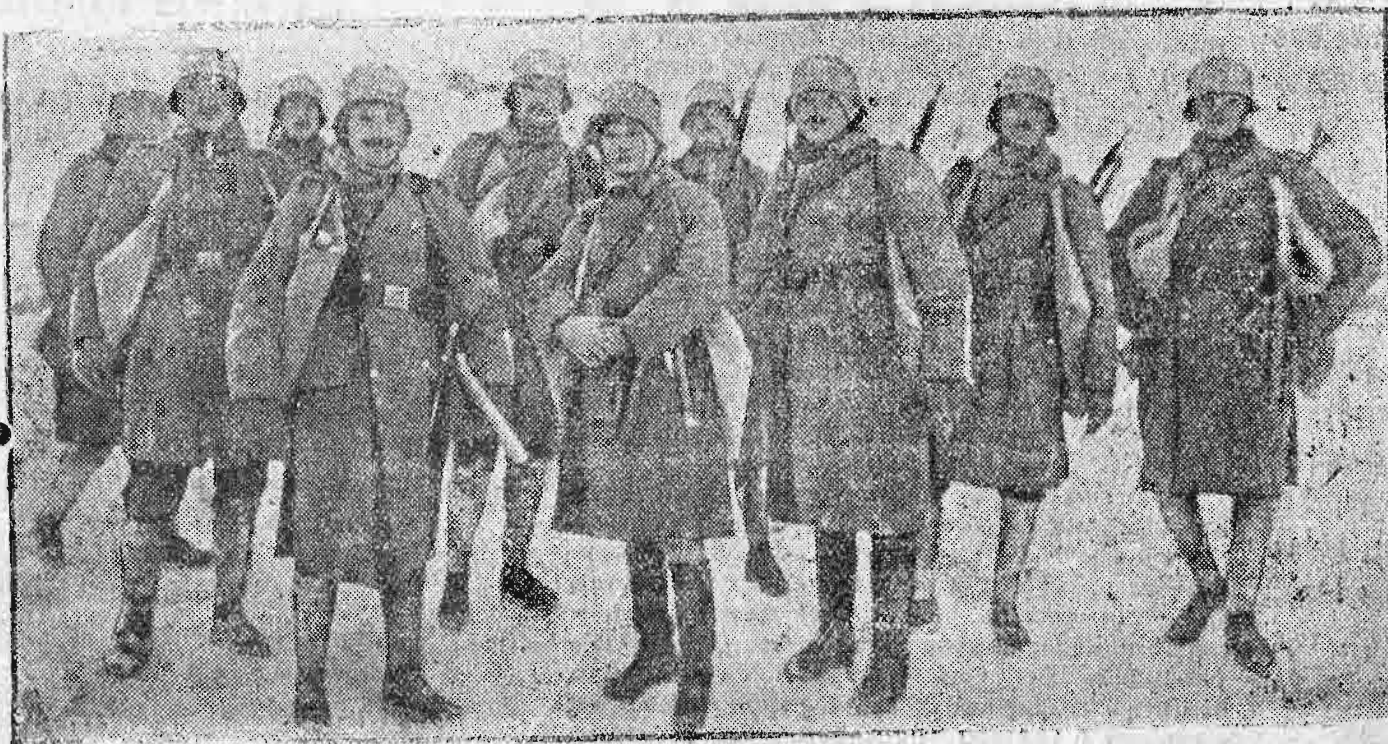
Νέα στολή τοῦ αὐστροουγγρικοῦ στρατοῦ μὲ χαλύβδινα κράνη.