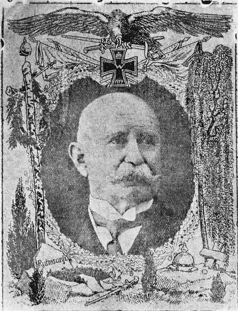
Ο εσχάτως αποθανών εφευρέτης των δμωνύμων αεροπλοίων Zeppelin.