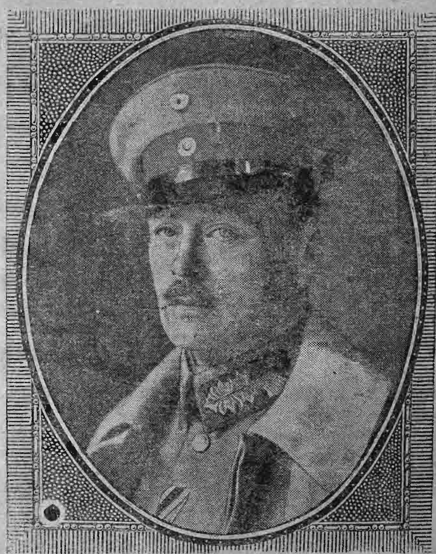
Ὁ Μέγας Δούξ Λουδοβίκος τῆς Ἑσσης.