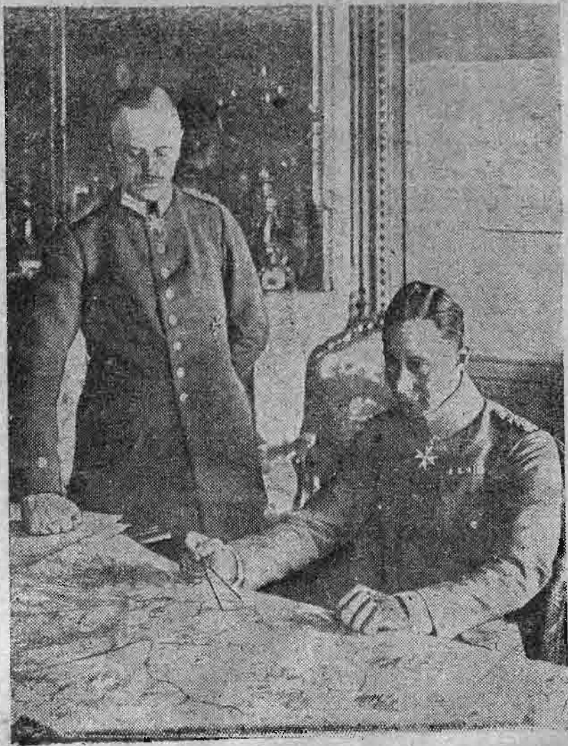
Ὁ Διάδοχος τῆς Γερμανίας μετὰ τοῦ ἐπιτελάρχου του.

ΕΙΚΟΝΟΓΡΑΦΗΜΕΝΗ ΕΠΙΘΕΩΡΗΣΙΣ, ΕΚΔΙΔΟΜΕΝΗ ΔΙΣ ΤΗΣ ΕΒΔΟΜΑΔΟΣ ΕΝ ΚΩΝΣΤΑΝΤΙΝΟΥΠΟΛΕΙ