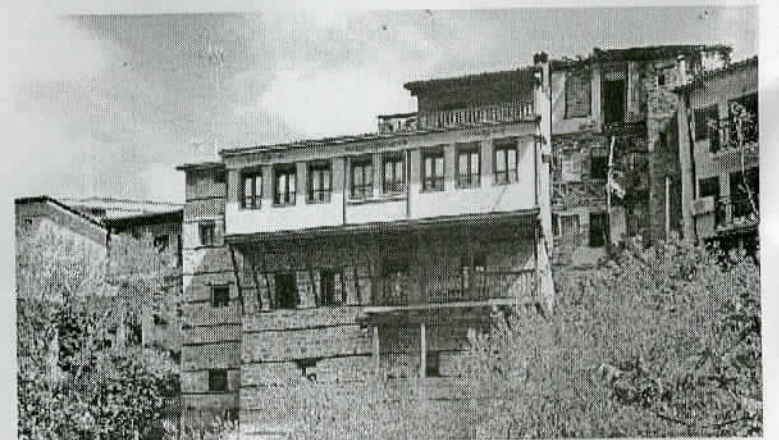
Το ανακαινισμένο "Κόκκινο Σπίτι" από την πλευρά του Τριπόταμου, που όμως είναι βαμμένη γαλάζια.

Ναι, αυτό πιστεύω κι εγώ. Περισσότερο με συγκινεί η δημιουργική εργασία και η ανάδειξη της παράδοσής μας. Το σπίτι που σήμερα είναι ξενοδοχείο το αγόρασα με σκοπό να γίνει η κατοικία