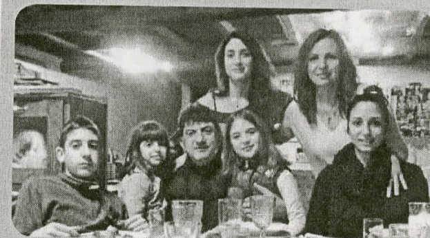
Μία οικογένεια που ζει με την παράδοση της πόλης