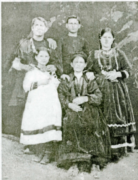
Η οικογένεια του παππού της Μπάτζιου-Χατζή

Όχι, από μικρή θυμάμαι αγαπούσα πολύ τα ρούχα. Είχα μια μεγάλη ντουλάπα κι ο πατέρας μου πάντα αναρωπιόταν τι τα θέλω τόσα πολλά ρούχα. Μου άρεσε το ωραίο ντύσιμο. Η μητέρα μου βέβαια όταν ήμασταν 12-13 χρονών μας έστελνε με την αδελφή μου στη μοδίστρα να μάθουμε, όπως έλεγε, να μπορούμε