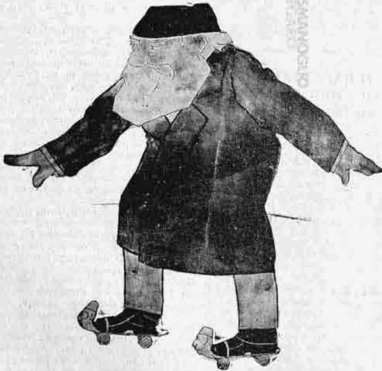
Παιναρὶ* ἐξαίρετα, κλονίζεται, ἀλλὰ δὲν πίπτει.