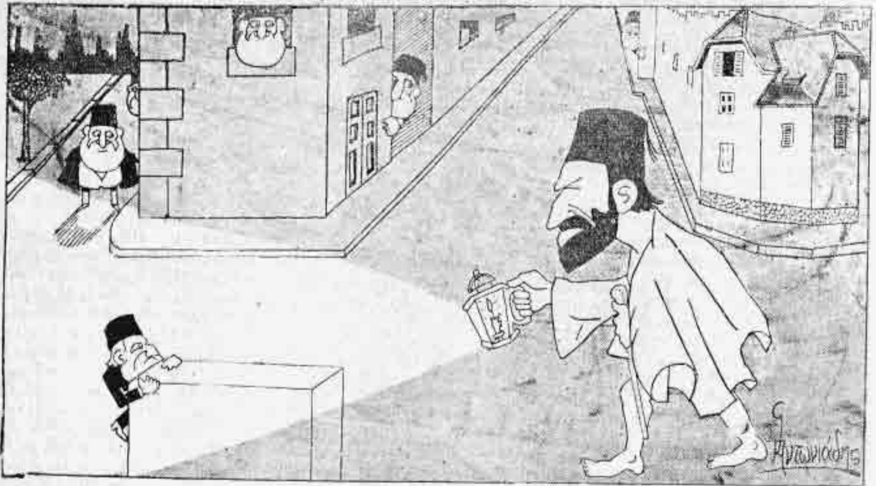
Τὸ κόμμα τῆς «'Ενώσεως καὶ Προόδου», ἀφοῦ, ὡς ἄλλοι Διογένης, ἐξήγησε νέους Μεγάλους Βεζύρας, δὲν εὔρε παντοῦ παρὰ Σαῖτ.