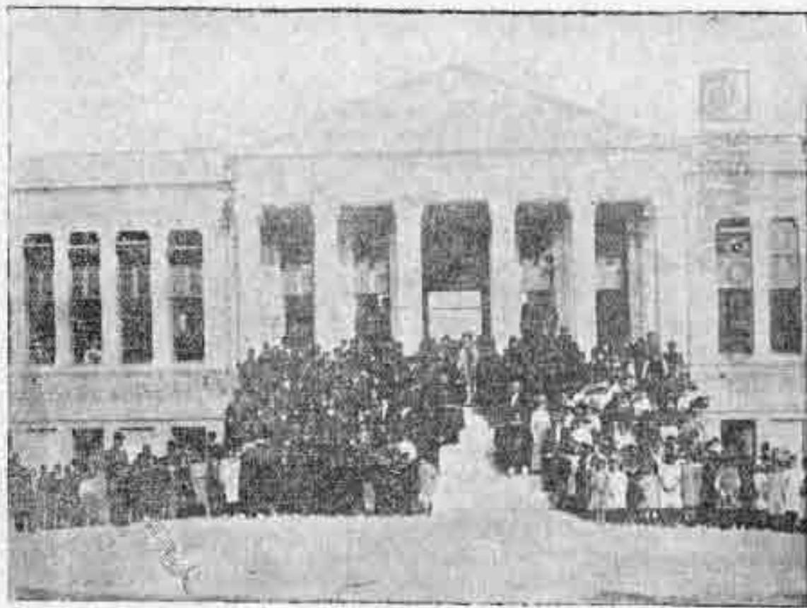
Τὰ ἐγκαίνια τῆς Σχολῆς.

Τὸ μέγαρον τοῦτο, οὐτινος τὰ ἐγκαίνια ἐγένοντο τὸν Ὀκτώβριον, στεγάζει πλήρη ὀκτατάξιον ἀστικὴν σχολὴν ἀρρένων, εἰς τὴν ὁποίαν φοιτῶσι περὶ τοὺς 400 μαθηταί, διδασκόμενοι ὑπὸ 7 διδασκάλων. Ἡ ἐτησία δαπάνη διὰ τὰς σχολὰς τῆς κοινότητος Ἀρτιάκης ἀνέρχεται τὸς 800 ὡς ἕγγιστα λίρας.