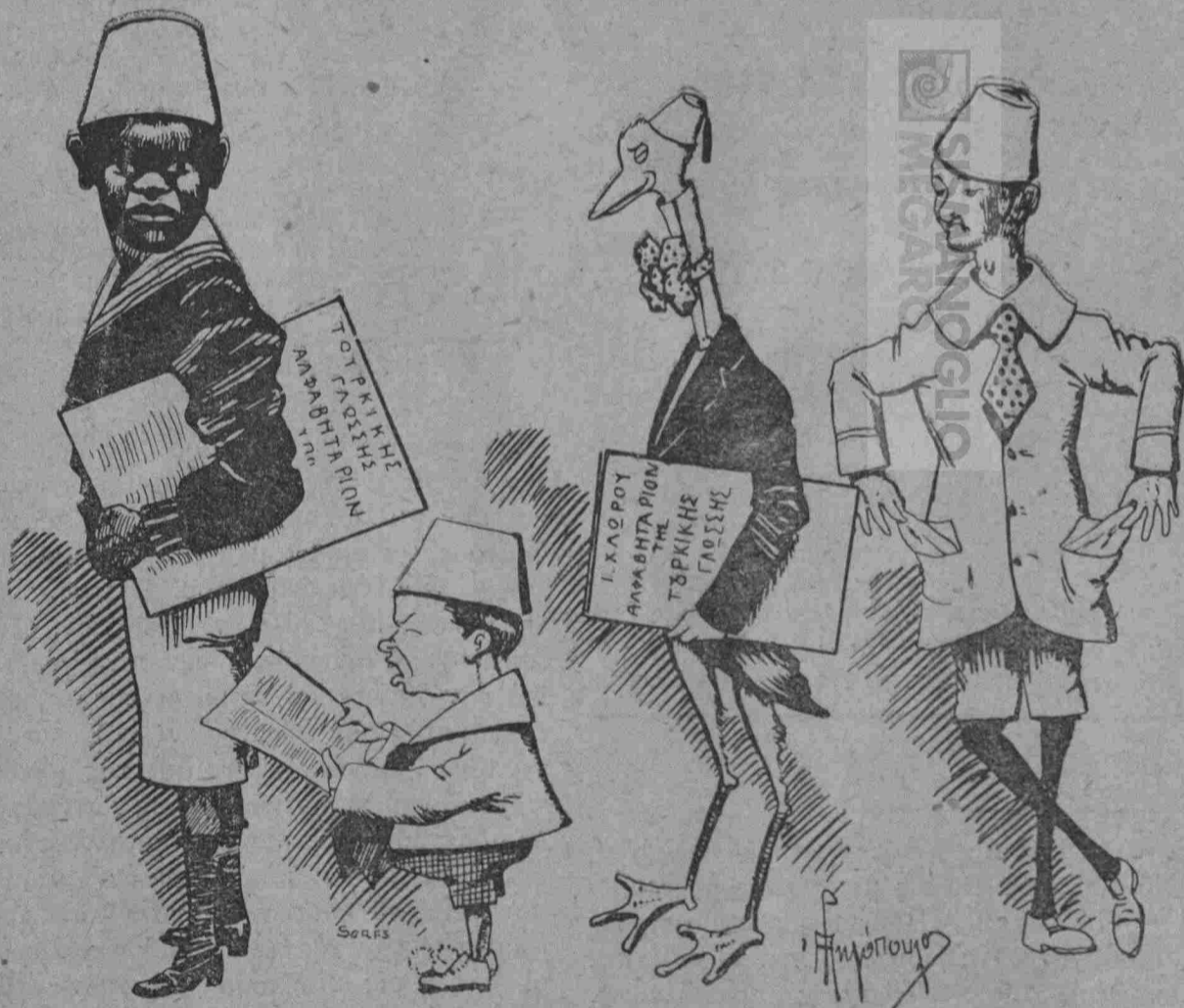
Ὁ Καρᾶ Γιάννης.