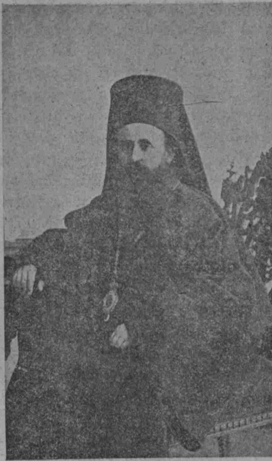
Ο ΜΗΤΡΟΠΟΛΙΤΗΣ ΚΟΡΙΝΘΩΝ ΓΕΡΜΑΝΟΣ

Θέλουμεν δημοσιεύει ἀνάγνωσιν παντὸς συγγράμματος φιλολογικοῦ ἢ ἐπιστημονικοῦ, ἀρκεῖ νὰ σταλῶσιν εἰς τὸ Γραφεῖον μας 2 αὐτοῦ ἀντίτυπα. Εἰδικοί συνεργάται ἀνέλαβον τὸ ἔργον τῆς βιβλιογραφίας.