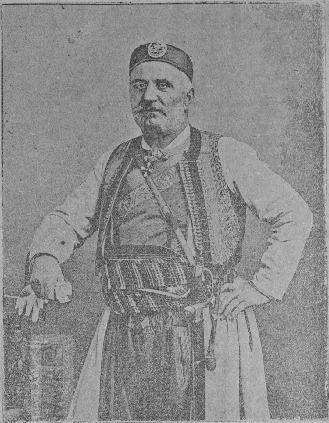
Ο ΠΡΩΤΟΣ ΒΑΣΙΛΕΥΣ ΤΟΥ ΜΑΥΡΟΒΟΥΝΙΟΥ ΝΙΚΟΛΑΟΣ Α'