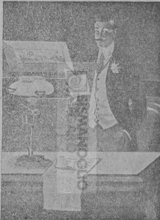
Καὶ ἀρχίζει νὰ τὴν διαβάξῃ ἐκ νέου.

— Ἄ! εἶναι ἀλήθεια! ὁ χαρακτῆρ της εἶναι αὐτός, τὸν ἀναγνωρίζω. Μέσα σ' αὐτὰς τὰς γραμμὰς