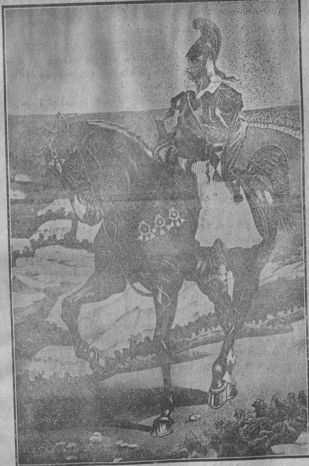
ΘΕΟΔΩΡΟΣ ΚΟΛΟΚΟΤΡΩΝΗΣ Ο ΓΕΡΩΣ ΤΟΥ ΜΩΡΗΑ

Ἡ ἐξοδὸς τῶν πολιορκουμένων ἐγένετο σφοδροτάτη. Ὅλοι μὲ τὰ σπαθιά εἰς τὰ χέρια ἐρρίφθησαν κατὰ τῶν Τούρκων. Οἱ Τούρκοι κατελήφθησαν ἐξαπίνης. Τρεῖς μόνον ἐκ τῶν πολιορκουμένων ἐφρονεύθησαν καὶ τινες γυναῖκες, ἠχμαλωτίσθησαν ὅμως ἀρκεταὶ γυναῖκες καὶ πολλὰ παιδιὰ, μεταξὺ τῶν ὁποίων καὶ δύο ἀδελφοὶ τοῦ Γέρω Κολοκοτρώνη, ὁ εἰς τριῶν ἐτῶν καὶ ὁ ἕτερος ἐνός.