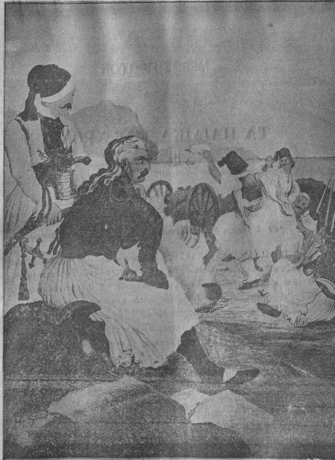
Ὁ Κολοκοτρώνης ἐν μέσῳ τοῦ διασκεδάλλοντος στρατοπέδου του.

» Ὅττε ἀπὸ τὰ 1753 ὅπου ἐράνηκαν εἰς τὰ μέρη μας — ὅταν γορεύει ὁ γέρων Κολοκοτρώνης — εἰ Τούρκοι ποτὲ δὲν τοὺς ἀνεγνώρισαν, ἀλλ' ἦσαν εἰς αἰῶνον πόλεμον.»