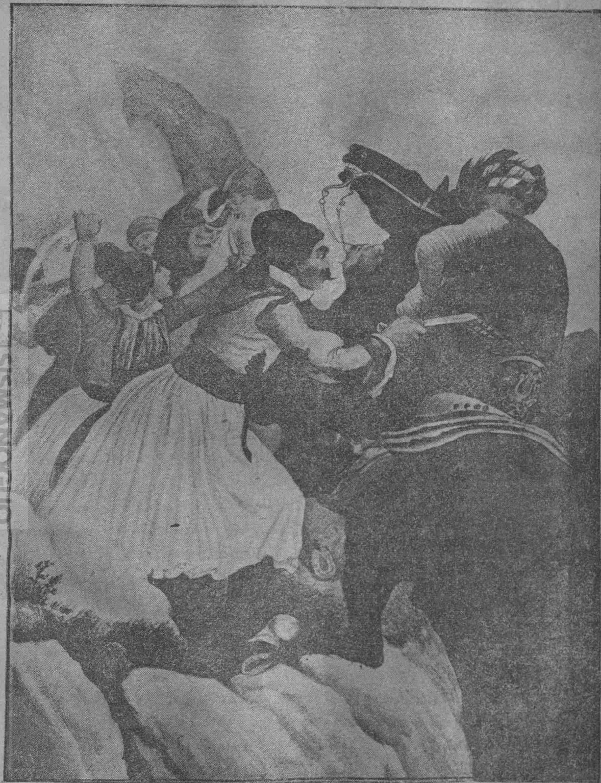
Ἡ ΚΑΤΑΣΤΡΟΦΗ ΤΟΥ ΔΡΑΜΑΛΗ Εἰς τὰ ΔΕΡΒΕΝΑΚΙΑ

Μεταβὰς δὲ καὶ ὁ ἴδιος εἰς Ἀχαΐαν, καὶ προχωρῶν διέταξε νὰ προπορευθοῦν ἐκ παραλλήλου τὰ διάφορα σώματα καὶ προκαταλάβουν τὰς καταλήλους θέσεις. Καὶ τὸν μὲν Κ. Πετμεζᾶν διέταξε νὰ τοποθετηθῇ εἰς Παλαόπυργον, τὸν δὲ Γενναῖον εἰς Ὀβριὰ καὶ τὸν