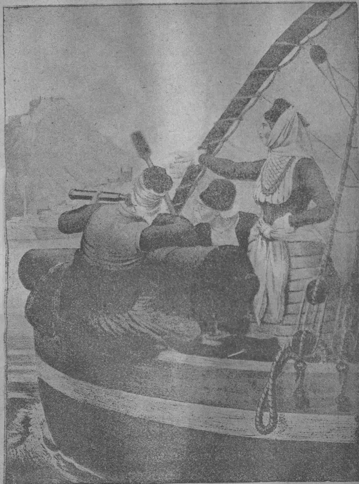
Ἡ ΜΠΟΥΜΠΟΥΛΙΝΑ ΑΠΟΚΛΕΙΟΥΣΑ ΔΙΑ ΘΑΛΑΣΣΗΣ ΤΟ ΝΑΥΠΑΙΟΝ

» — Ὅχι φίλε μου, τοῦ εἶπεν ὁ Μπουλούμπασης, αὐτὸ ἦτανε νὰ σοῦ κάμω ἀπόκρισι μὲ πράγματα καὶ ὄχι μὲ λόγια γιὰ ἐκεῖνο ποῦ μὲ παρακάλεσες γιὰ τὸν Γιάννη, γιὰ νὰ ἐννοήσῃς ὅτι θὰ σοῦ μιλήσω ὡς φίλος ἀληθινός καὶ ὄχι ὅτι ἀποφεύγω· ἐκατάλαβα καὶ ξέρω τί καὶ πῶς ἐκάματε. Εἰς κάθε χωριό, φίλε μου, εἶναι καλὸ νὰ εὐρί- σκωνται ἀπὸ ὅλα, καὶ ἕνας παλαιὸς γέρος γιὰ μιὰ γνωστικὴ συμ- βουλή καὶ κάμμια ξεπεσμένη γιὰ νὰ γλυτώνῃ τὴν τιμὴν τῶν τί-