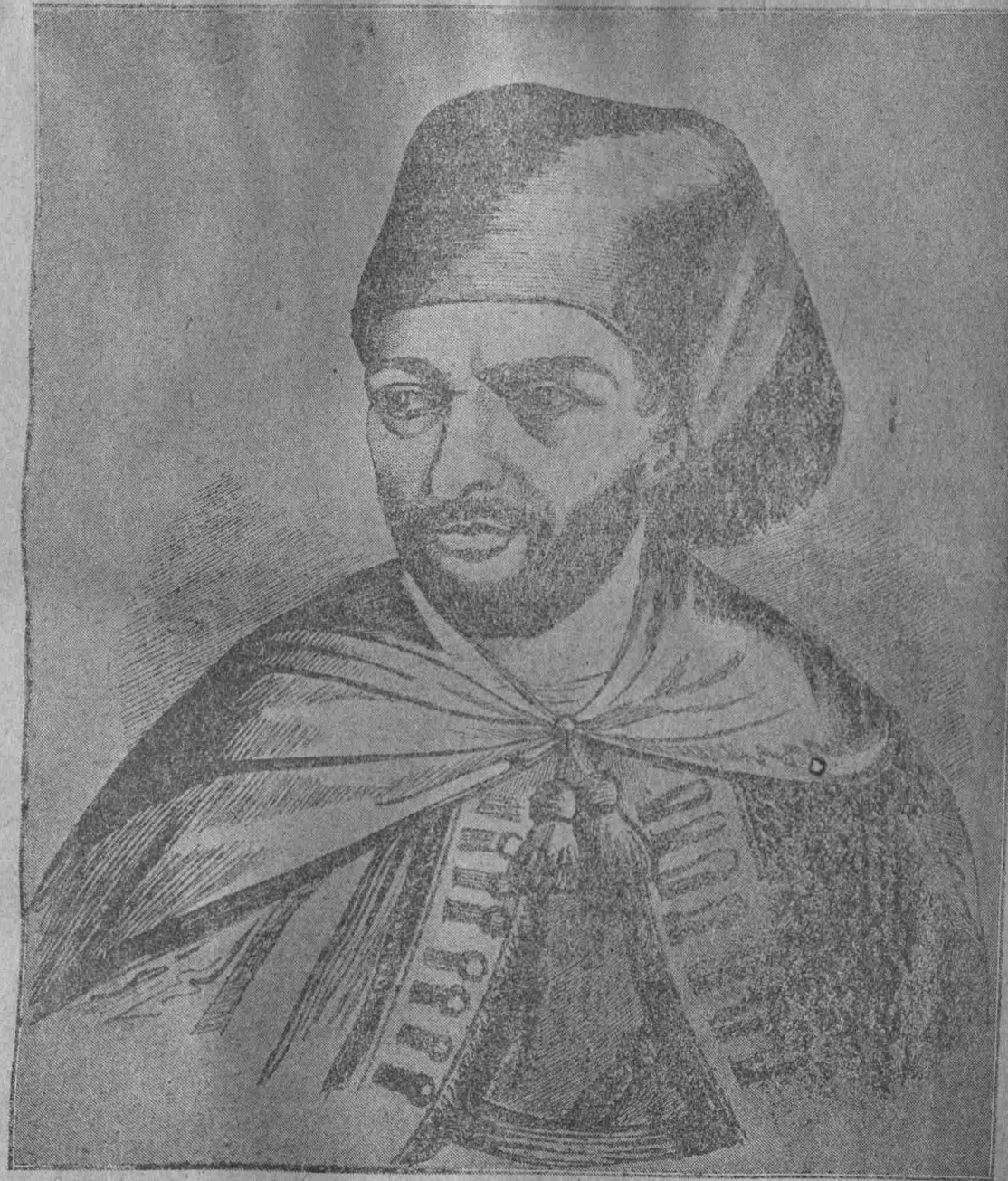
Ο ΙΒΡΑΪΜ ΠΑΣΑΣ ΤΗΣ ΑΙΓΥΠΤΟΥ

Ἐξ ἐναντίας πεζοὶ ἑλαφροὶ τὸ πρῶτον ἐτράπησαν εἰς ἀνάβασιν ἐκ τῆς ἀνατολικῆς τοῦ στενοῦ παρειᾶς, ἤτοι πρὸς τὸ ὄρος Πανάγο, ὅπου εἶναι πάροδος, διερχομένη διὰ τῆς ὑπερκαιμένης θέσεως Ἁγίου Σώστης, ὅπου πάλιν σχηματίζεται στενὸν τι, καὶ αὕτη δύσβατος, ἀγούσα εἰς τὸ κατὰ τὰς Κλεωνᾶς πεδίον, ἐκκλινομένου τοῦ Δερβενακίου καὶ ἧτις ἐφαίνετο ἀφυλάκτος.