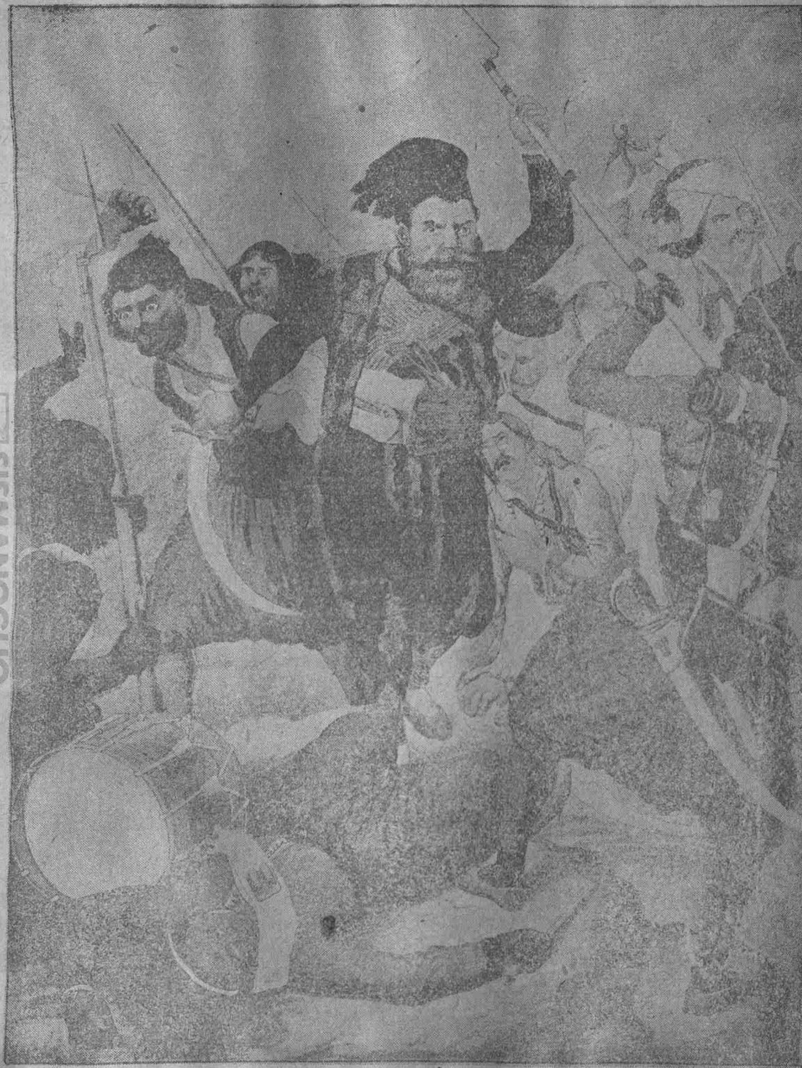
Ἐπίθεσις τῶν μανιατῶν κατὰ τῶν ἀραβικῶν στρατευμάτων τοῦ Ἰβραήμ.

Εἶτα κινηθέντες οἱ Τούρκοι καὶ πρὸς τὴν Ἀράχωβαν, ὅπου ἦσαν ἐστρατοπεδευμένοι ἕως 1500 ὑπὸ τοὺς Χατζῆ Στεφανῆν καὶ Χατζῆ Γεώργην, ἔτρεψαν μὲν τούτους εἰς φυγὴν, ἀντίστη δ' εἰς τὴν ὁρμὴν τῶν μὲ μόνον 50 ὁ Ζαχαρόπουλος, ἕωσοῦ τότε τυχαίως προφθάσας καὶ ὁ Κολοκοτρώνης καὶ ἐκ τῶν φευγόντων ἕως 500 ἀναχαιτίσας, μετ' αὐτῶν καὶ τοῦ Ὑψηλάντου ἔτρεξαν καὶ ἐξεδίωξαν εἰς τὰ ἐπίσω τοὺς Τούρκους, ὅτε ὁ Ὑψηλάντης ἀπεσύρθη εἰς Ναύπλιον.