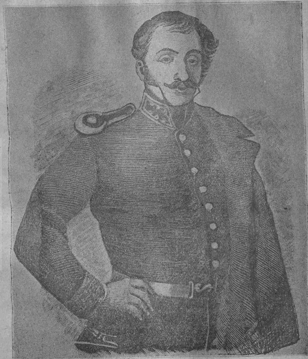
Ο ΗΡΗΓΚ ΠΨ ΔΗΜΗΤΡΙΟΣ ΥΨΗΛΑΝΤΗΣ

Ὁ Κολοκοτρώνης ἀπέμεινε καὶ πάλιν μὲ τὸ ἄλογόν του, τὸν πιστότερον σύντροφόν του καὶ ἔτρεξεν ὀπισθεν τῶν ἄλλων.