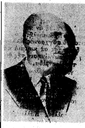
Του υποψηφίου Βουλευτού της Ένωσεως Κέντρος