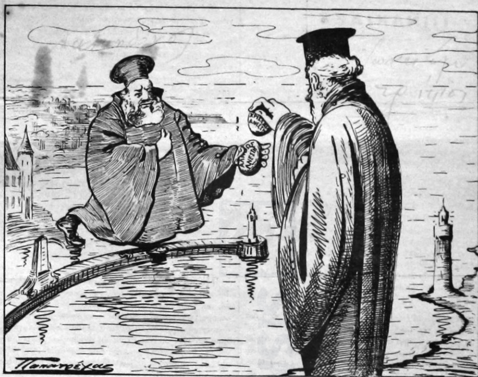
"Αίντε νὰ διοῦμε ποιὸς ποιόνα νὰ σπασῇ.

Χριστὸς ἀνέστη ἐκ νεκρῶν καὶ δαίμονες πεπτῶκασι φαιδρὰ ἀκούμε ὡσανὰ ἀγγέλων οὐρανίων δίδουμε κόκκινα αὐγά σ' ἐκείνους τοῦ δεδῶκασι τὰς ψήφους τῶν ὑπὲρ ταγῶν τὰ μάλα πειθηνίων, ὑπὲρ ἀνδρῶν τοῦ κόμματος καθ' οὗ καὶ πύλαι Ἄδου οὐ κατιχύσωσι ποτε παρόντος Βασιλεύου.