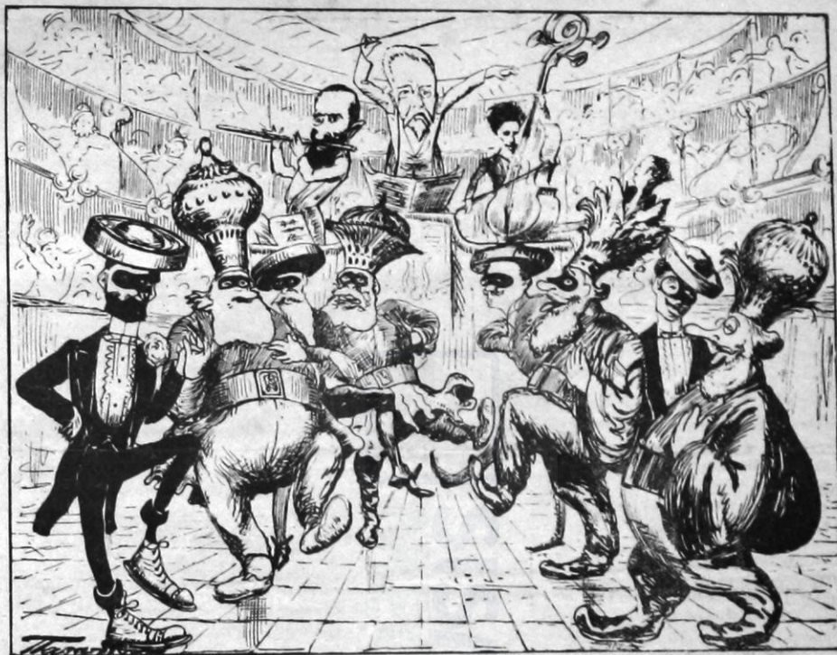
Καταχθόνιος χορός πούν' και τούτος ιερός.

ν' αφήσουν τὸ γινάτι νὰ παύση περὶ ἡ ἔρις.