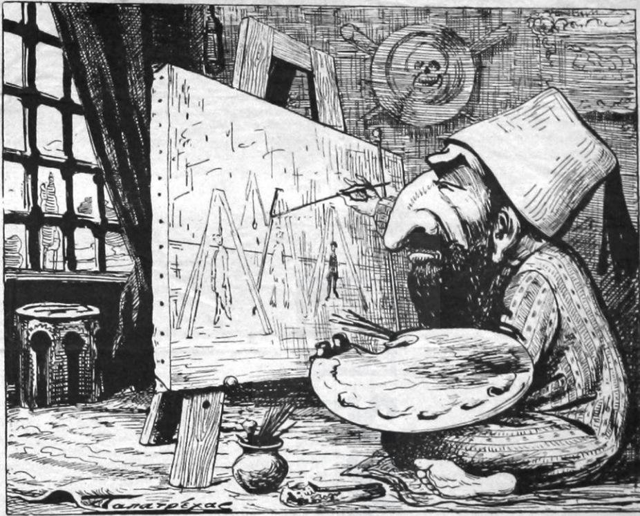
Τὰ πρῶτα βήματα τοῦ Χαμητῆ εἰς τὴν ζωγραφικὴν.