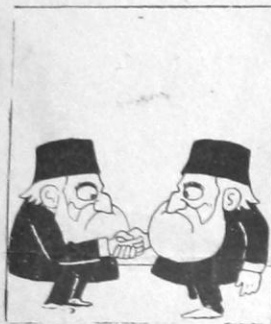
Σαίτ. - Σε συγχώρω Σαίτ πα- σιά διά τόν διορισμόν σου.