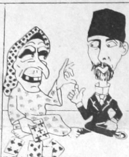
- Θα ζήσης και θα γερῶς Καρολίδη ἐγέντη. - Τι μ' ὄφειλε νά γερῶσα ἄν δέν γίνω και γεροντιστής....