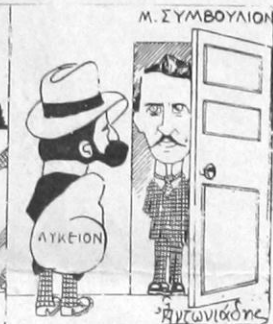
Τζέφν. - Τουλάχιστον ἀπό τά ἐλέη δόστε τίποτε γιά τὸ Λύκειον.

Αὐτά ἀπό τοῦ βήματος και πάλιν ἀναπτύσσει και ἀπειλεῖ παραίτησιν νά δώσῃ ἐκ δευτέρου, μὰ κ' ἡ Βουλὴ δέν ἐννοεῖ ποσῶς ν' αὐτοκτονήσῃ και μὲ γενναίη πολεμῆ τὴν πεισιμονῆ τοῦ γέρον.