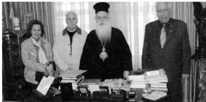
Εικόνα 1 Από την επίσκεψη του Δ.Σ. στον Σεβασμιότατο Μητροπολίτη Βεροίας, Ναούσης και Καμπανίας κ. κ. Παντελεήμονα.