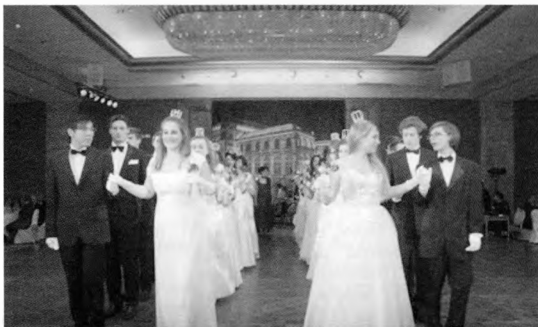
Η Εκδήλωση θα ενισχύσει τους σκοπούς του Συλλογου «Φλόγα» και το « Άσυλο του Παιδιού Θεσσαλονίκης »

Υπό την Αιγίδα της Α.Ε. του Προέδρου της Δημοκρατίας Κάρολου Παπούλια και με την ευγενική υποστήριξη των Δήμων Αθηναίων & Βιέννης και την Πρεσβεία της Αυστρίας στην Ελλάδα, ο Σύλλογος Ελλήνων Φοιτησάντων εν Αυστρία, με την σύμπραξη του Συνδέσμου Γυναικών Θεσσαλονίκης-Μακεδονίας, εν Αθήναις, σας προσκαλούν στην ετήσια Χοροεσπερίδα τους 25 Ιανουαρίου 2014, ημέρα Σάββατο και ώρα 9 μ.μ. Ξενοδοχείο Hilton (Αίθουσα «Τεοψιχόρη»)