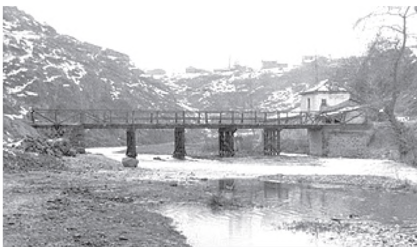
Η παλιά ξύλινη γέφυρα - περασιά του Τριπόταμου

Εκεί στο απόσκιο είχε στεριώσει μία παράγκα, ένας σεριανιστής της