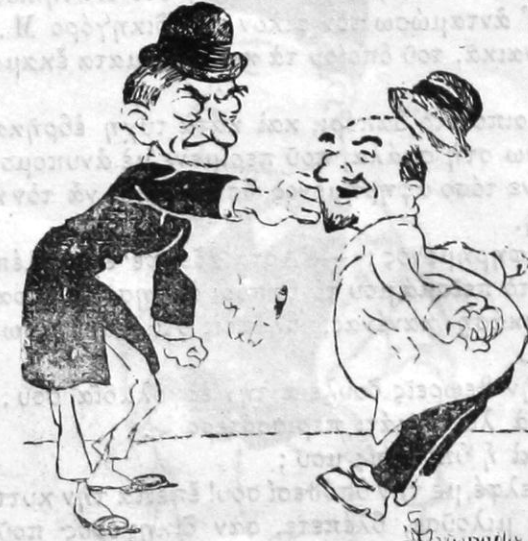
Καβαλλιέρος.—Νά ! πάρε αυτήνα !

Άκριβῆς εκτέλεισι Συνταγῶν, διάφορα εύρωπαϊκά εἶδη (Spécialités), Μεταλλικά Νερά κτλ. Ιατρικαί Συμβουλαί δωρεαν.