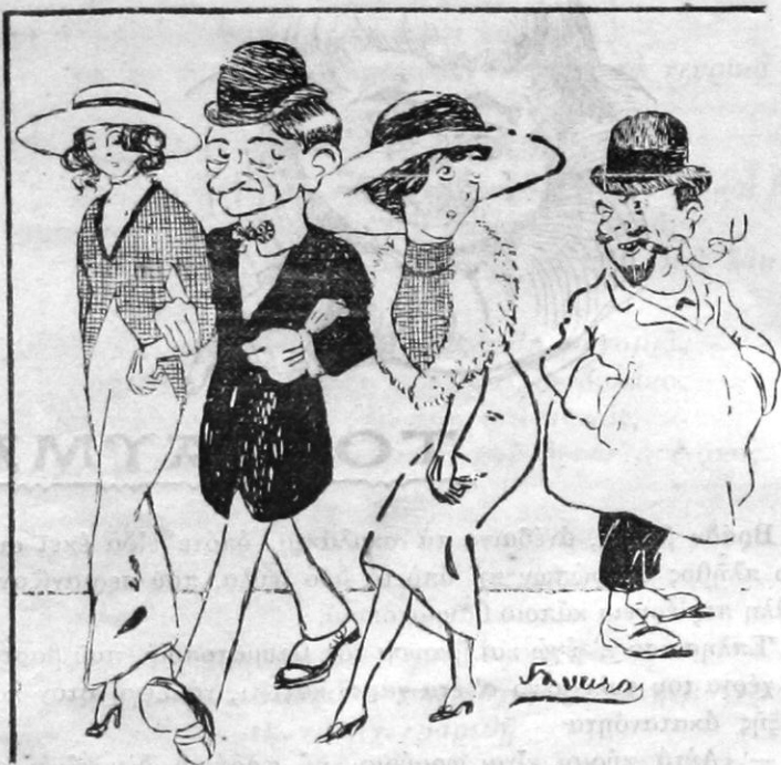
Δὸν Ζουάν.— Ποιὰν ἀπ' τῆς δυό;