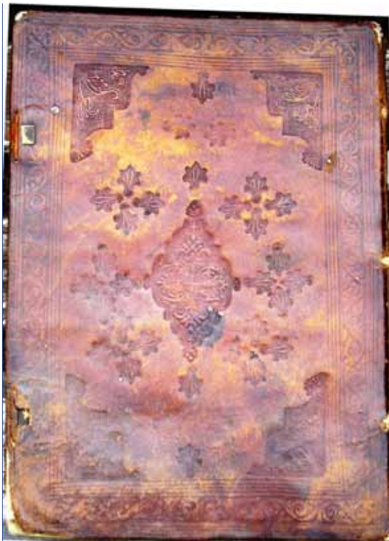
Δερμάτινη στάχωση Ευαγγελίου από το εργαστήριο του Χατζή παπά – Παναγιώτου (1744) - (Ι. Ν. Αγ. Αναργύρων Βέροιας)

Πέντε χρόνια νωρίτερα (1745), την περίοδο που μητροπολίτης Βεροίας ήταν ο Ιωακείμ Α', μάστορες οι οποίοι πιθανότατα συνδέονται με το ίδιο εργαστήριο αναλαμβάνουν την ανακαίνιση δύο ακόμη ναών του Ανατολικού Βερμίου, του ναού της Παναγίας του Μελισσιού(;) στην περιοχή μεταξύ Κωστοχωρίου και μονής Παναγίας Δοβρά και του ναού των αγίων Αποστόλων Πέ-