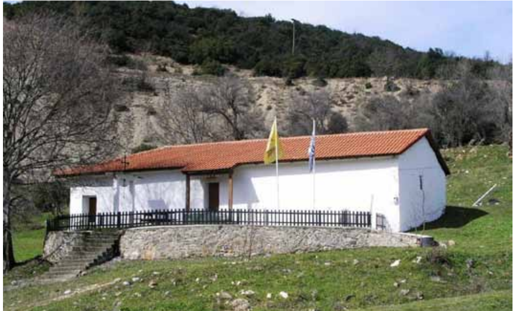
Ο Ι. Ν. Αγ. Νικολάου στο Λοζίτσι στη σημερινή του μορφή