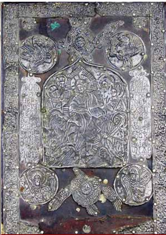
Αργυρή επένδυση Ευαγγελίου από το εργαστήριο του Χατζή παπά – Παναγιώτου (1744) (Ι. Ν. Αγ. Αναργύρων Βέροιας)

οποίος προέρχεται από το μοναστήρι της Παναγίας Δοβρά. 14