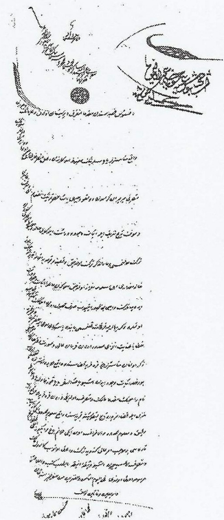
Εικ. 1 Σιπαχικός τίτλος ιδιοκτησίας Παναγίας Δοβρά, 2 στον οποίο καταγράφονται ιδιοκτησιακά στοιχεία της, ύστερα από αίτηση του τότε διαχειριστή και εφόρου του βακουφίου της μονής μοναχού παπά Παναγιώτου, πληροφορούμαστε ότι το μοναστήρι διέθετε, μεταξύ άλλων, πέντε αγρούς στην «άνωθι του Μοναστηρίου» θέση Μαύρη Πέτρα, 3 οι οποίοι συνόρευαν με κτήματα της «Μονής του Αγίου Αθανασίου». Μέχρι στιγμής, η ύπαρξη μονής στην περιοχή αφιερωμένης στον άγιο Αθανάσιο, μας είναι άγνωστη από άλλες πηγές. Ο σιπαχικός αυτός τίτλος 4 αναφέρει τα εξής (εικ. 1):