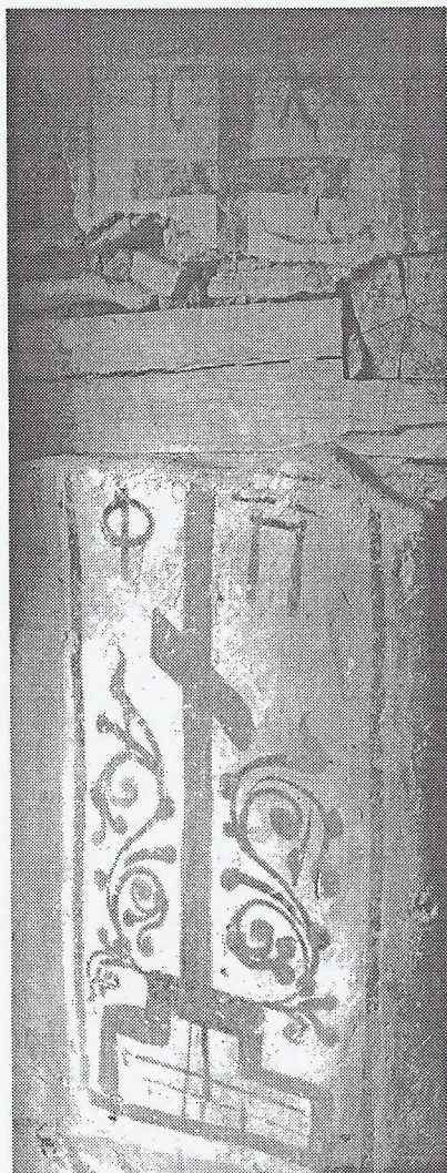
Εικ. 2 Παράσταση στο ναΐσκο του αγίου Αθανασίου στο Κωστοχώρι

μοναστηριακά κτίσματα της περιόδου, η οποία εικονίζει το σύμβολο του σταυρού με την καθιερωμένη επιγραφή ΙΣ ΧΡ [ΝΙ ΚΑ] και τα αρχικά γράμματα Φ και Π (εικ. 2).