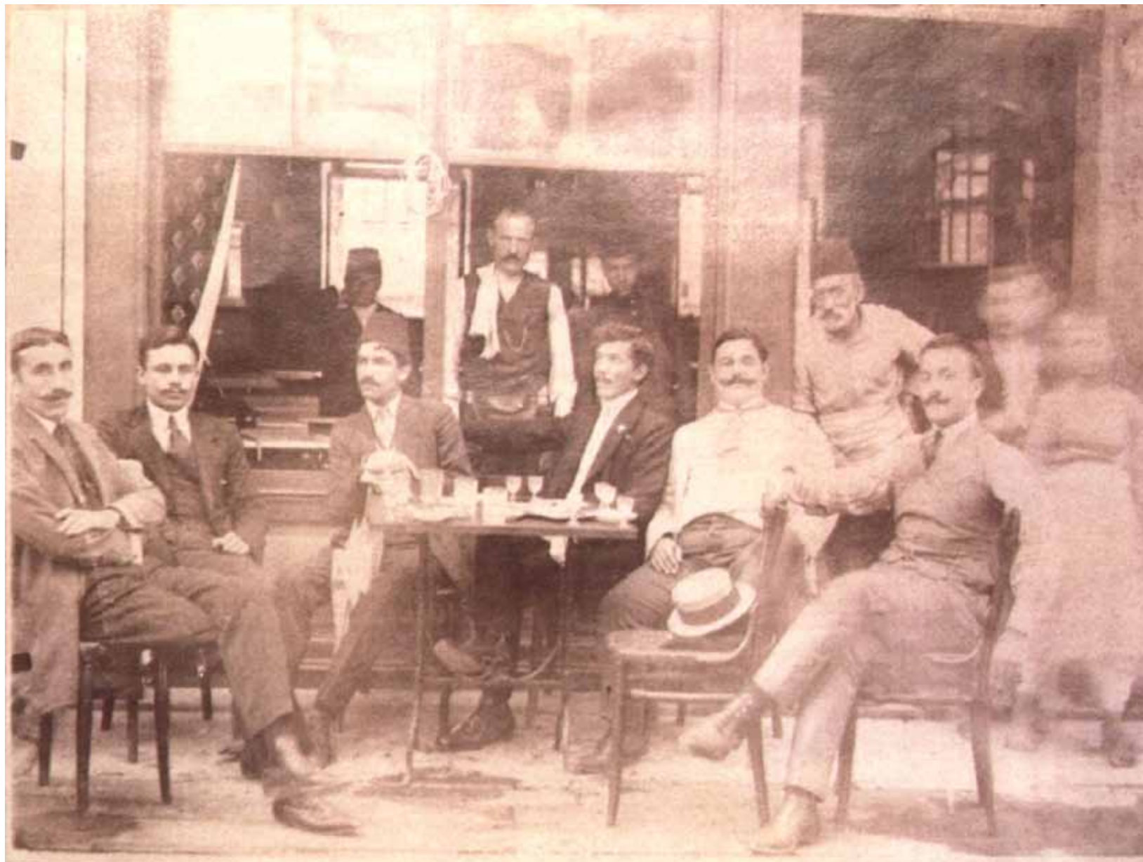
Καφενείο της ύστερης Οθωμανικής περιόδου στη Βέροια (Ξενοδοχείο Όλυμπος, 1912)

χιμανδρίτη Πανάρετο. Το γεγονός αυτό φανερώνει την προσπάθεια των κοινοτικών παραγόντων της πόλης για έλεγχο και παρεμβατισμό στις εμπορικές δραστηριότητες των επαγγελματιών της Βέροιας, κάτι που επιχειρήθηκε να επιτευχθεί μέσα από την εφαρμογή κανόνων και διατάξεων που θα προσλάμβαναν συνολικό και κοινοτικό χαρακτήρα.