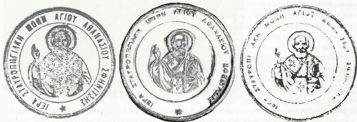
Σφραγίδες του μοναστηριού νεότερου τύπου (εμφανίζονται σε έγγραφα από τη δεκαετία του 1930)

Πάντως, σε όλα τα έγγραφα του μοναστηριού του 20 ου αιώνα, τα οποία έχουμε υπόψη μας (από τη δεκαετία του 1930 και εντεύθεν), εμφανίζεται η χρήση διαφορετικού τύπου σφραγίδων, 20 οι οποίες σε καμία περίπτωση δεν μπορούν να συγκριθούν, από άποψη τεχνολογίας και αισθητικής, με την παλαιότερη. 21