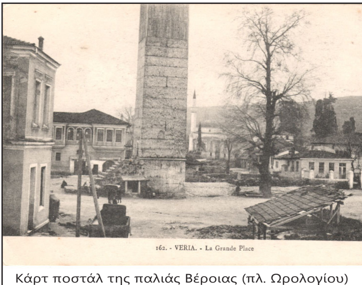
Κάρτ ποστάλ της παλιάς Βέροιας (πλ. Ωρολογίου)

Ο πρώτιστος σκοπός της Ε.Μ.Ι.Π.Η. αφορούσε και αφορά στην ανάδειξη της τοπικής ιστορίας, σκοπό για τον οποίον εργάστηκε επιμελώς φροντίζοντας να πραγματευεται ένα ευρύ φάσμα θεμάτων (λαογραφικών, αρχαιολογικών, ιστορικών, πολιτισμικών κ.α.)