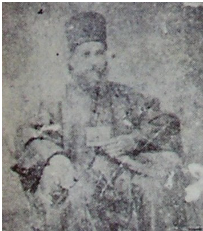
Επάνω: «Ο μέγας τής Βερροίας ευεργέτης Μελέτιος ο Κωνσταμονίτης»