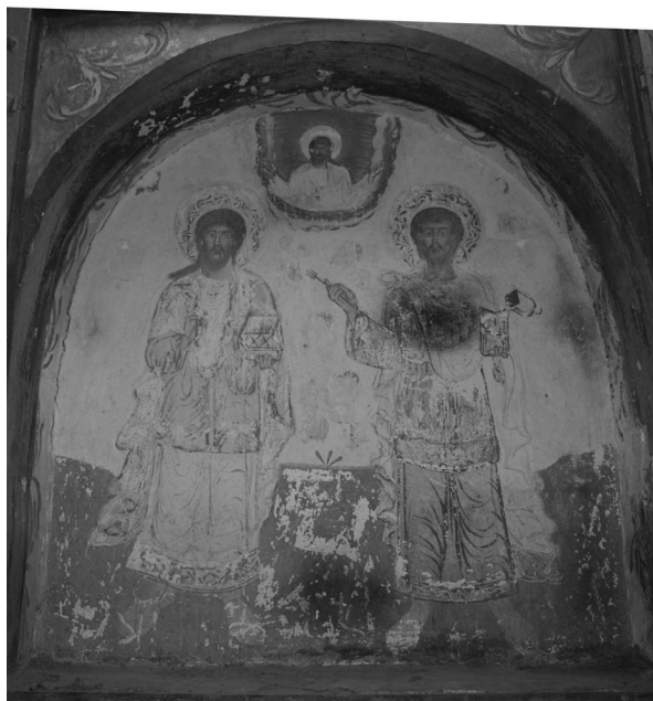
Εικ. 2 Παράσταση των αγίων Αναργύρων Κοσμά και Δαμιανού στο υπέρθυρο της νοτίας εισόδου του καθολικού της μονής