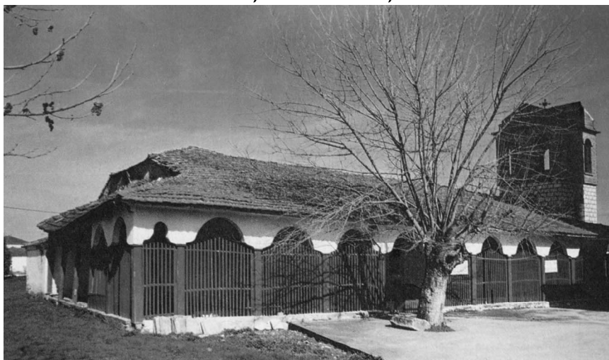
Εικ. 1 Το καθολικό της μονής των αγίων Αναργύρων στο Νησί (1990)