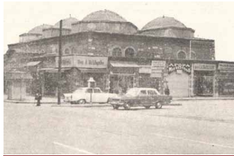
Το μπεζεστένι της Θεσσαλονίκης σε φωτογραφία των μέσων του 20ου αι.

των καταστημάτων και αφετέρου εξυπηρετούσε, με μεγαλύτερη ευκολία, τις αγοραστικές ανάγκες των υπηκόων, αλλά και τον έλεγχο από μέρος των αρχών, χωρίς ωστόσο να λείπουν και οι περιπτώσεις που, για πρακτικούς κυρίως λόγους, υπήρχαν και καταστήματα καταναλωμένα σε άλλες περιοχές. Οι οθωμανικές αγορές χτίζονταν συνήθως σε κεντρικά σημεία των πόλεων, στις περισσότερες μάλιστα περιπτώσεις κοντά σε τζαμιά.