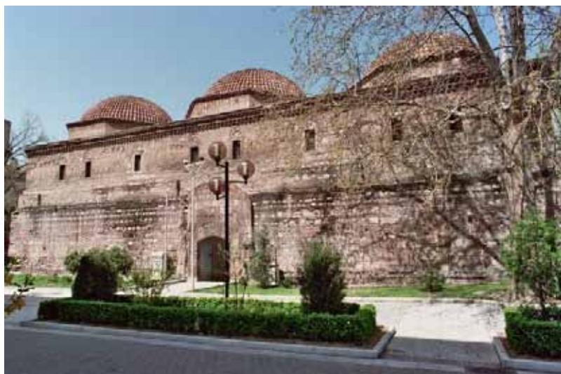
Το μπεζεστένι των Σερρών (β' μισό 15ου αι.) Από το 1970 στεγάζει το Αρχαιολογικό Μουσείο Σερρών

Επιπλέον, από την ίδια την παράσταση του τζαμιού του Μενδρεσέ,