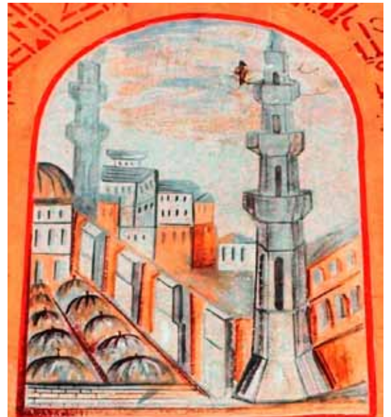
Η παράσταση του μπεζεστενιού (οθωμανικής αγοράς) της Βέροιας