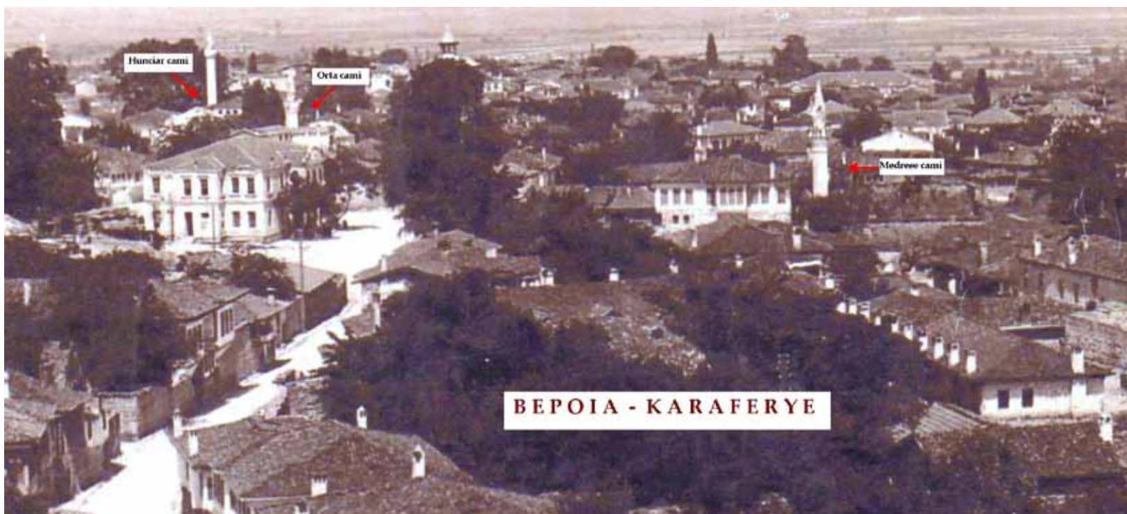
ΒΕΡΟΙΑ - ΚΑΡΑΦΕΡΥΕ

πόρτα, το οποίο ήταν βακούφι του Τσελεμπί Σινάν μπέη. 9