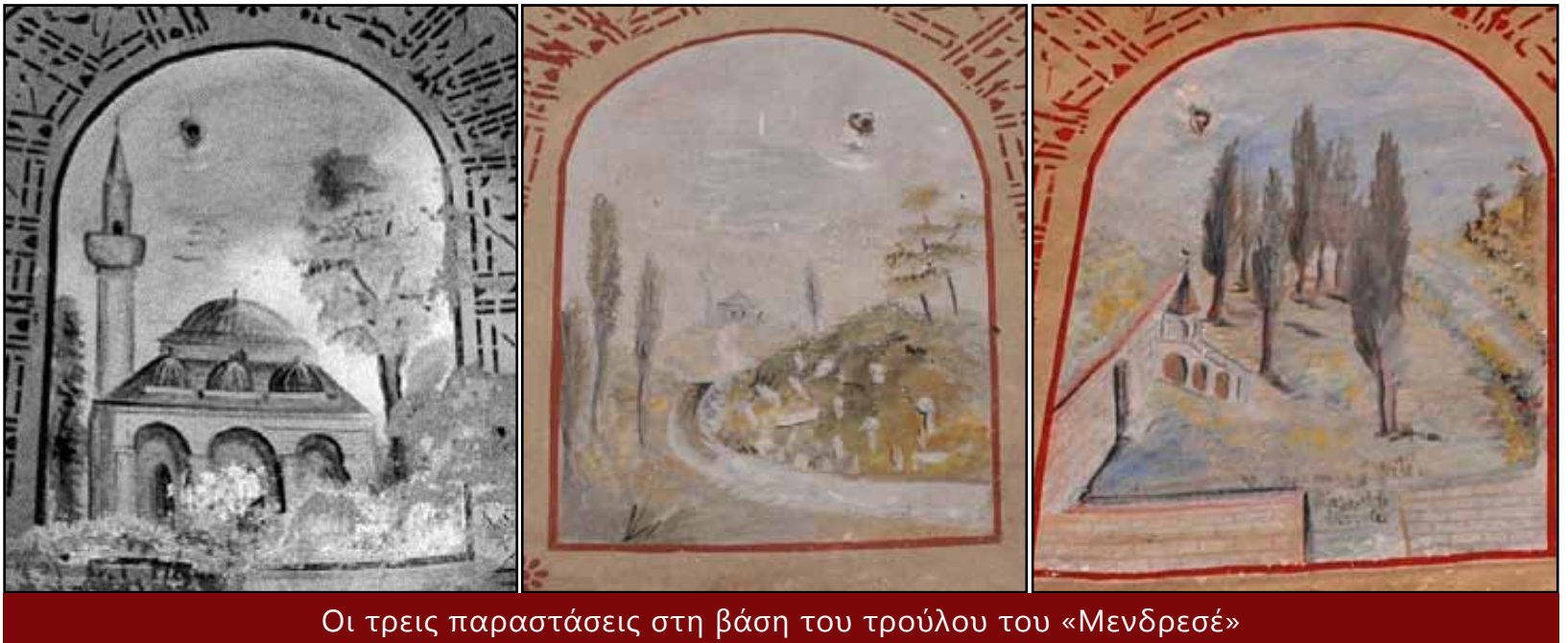
Οι τρεις παραστάσεις στη βάση του τρούλου του «Μενδρεσέ»

επίσης πολυγωνικά, şerefeler (μπαλκόνια – εξώστες), 13 ενώ στη σημερινή του μορφή είναι κυλινδρικός. Μάλιστα, όπως διακρίνεται σε φωτογραφία των αρχών του 20 ου αιώνα, ο μιναρές διέθετε ένα μόνο şerefe. Εντούτοις, οφείλουμε να παρατηρήσουμε ότι η βάση του μιναρέ στο Hunciar camı, μέχρι και σήμερα είναι πολυγωνική. Η ίδια προβληματική παρατηρείται και στον μιναρέ του τζαμιού το οποίο θεωρούμε ότι πιθανότατα ταυτίζεται με το Orta camı. Ο μιναρές του εικονογραφείται, επίσης, με τρία şerefeler, 14 ενώ στη σημερινή του μορφή, αλλά και σε φωτογραφίες των αρχών του 20 ου αιώνα, παρουσιάζει ένα μόνο şerefe.