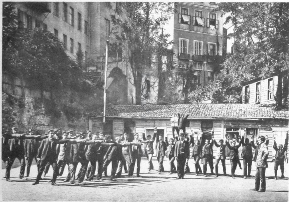
9. Ἑλληνογαλλικὸν Αὐχεῖον Χρήστου Χατζηχρήστου ἐν Κωνσταντινουπόλει. — Γυμναστήριον