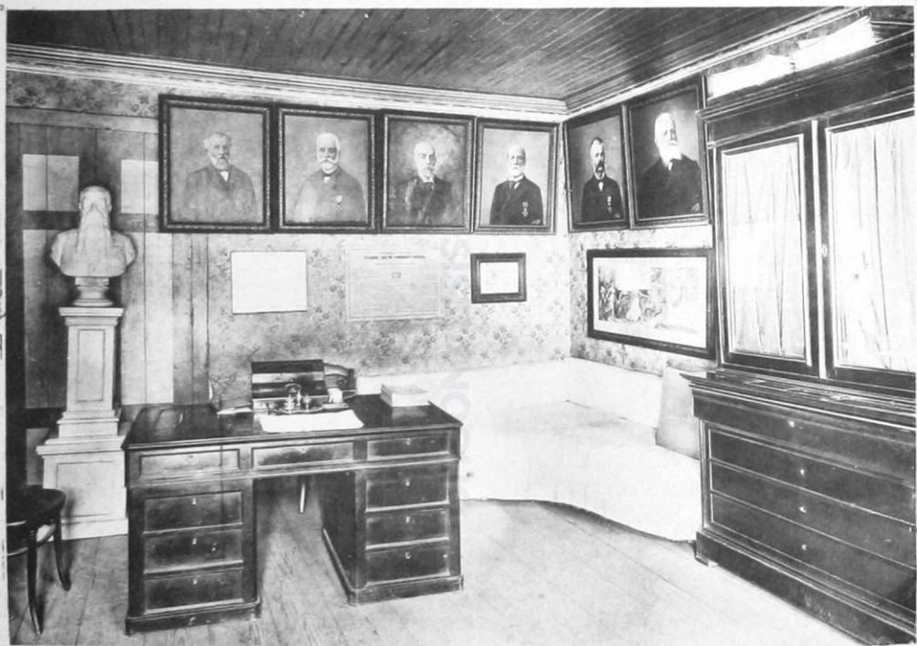
3 - 'Ελληνογαλλικόν Αύκειον Χρήστου Χατζηχρήστου έν Κωνσταντινουπόλει. — Ιαλεεστήριον