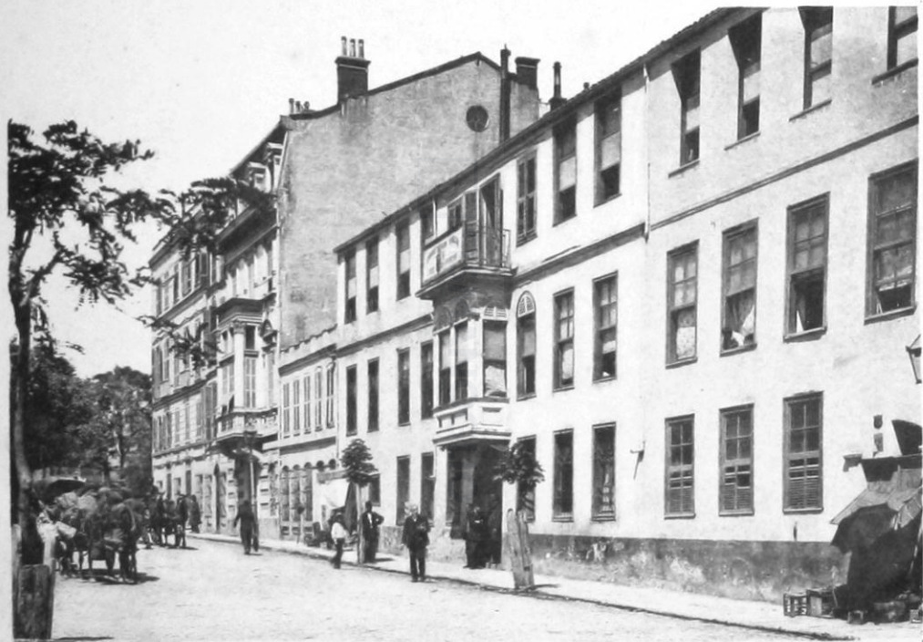
1 - 'Ελληνογαλλικόν Αύκειον Χρήστου Χατζηχρήστου έν Κωνσταντινουπόλει. — Πρόσωπις.