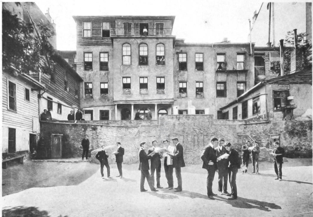
2- Έλληνογαλλικόν Αύκειον Χρήστου Χατζηγρήστου έν Κωνσταντινουπόλει. — Ανατολική όπισθία πρόσοψις