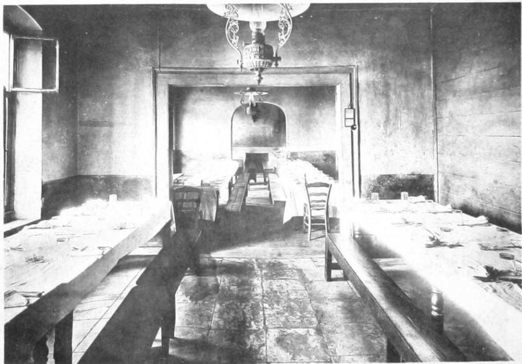
6- Ἑλληνογαλλικὸν Αὐχεῖον Χρήστου Χατζηχρήστου ἐν Κωνσταντινουπόλει. — Ἐστιατόριον,