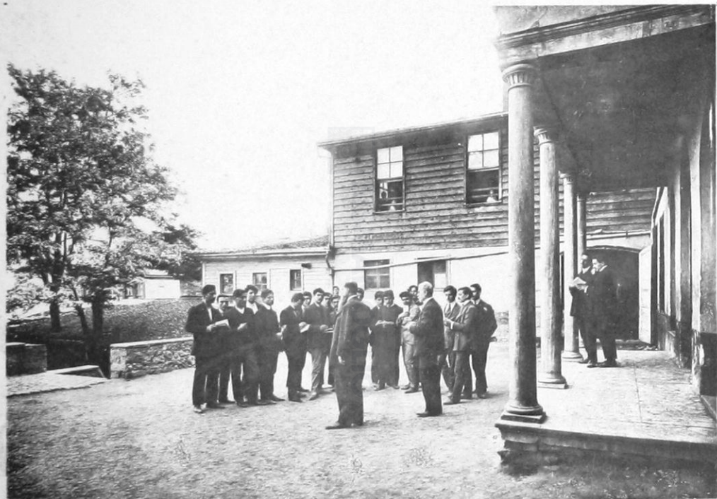
7- Ἑλληνογαλλικὸν Αὐχεῖον Χρήστου Χατζηηγήστου ἐν Κωνσταντινουπόλει. — Προαύλιον.