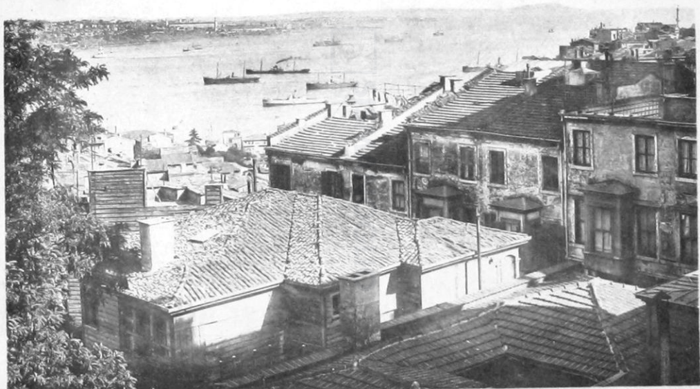
10- Έλληνογαλλικόν Αύκειον Χρήστου Χατζηχρήστου έν Κωνσταντινουπόλει. - Θέα 'Ανατολική έκ τοῦ Αὐκείου.