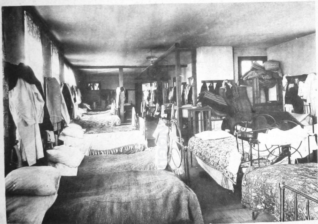
5- Ἑλληνογαλλικὸν Ἀνέκειον Χρήστου Χατζηχρήστου ἐν Κωνσταντινουπόλει. — Κοιτῶν.