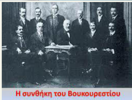
Η συνθήκη του Βουκουρεστίου

Γενικά η Συνθήκη Βουκουρεστίου (1913) με την άμεση σχετικά συνομολογήση και υπογραφή της υπήρξε πολύ σημαντική ιδιαίτερα στους Συμμάχους (Ελλάδα, Σερβία και Ρουμανία) δια της οποίας εκτός του ότι ορίστηκαν τα σύνορα της ηττημένης Βουλγαρίας με τις όμορες σύμμαχες και νικήτριες Χώρες, ταυτόχρονα απετράπει και η όποια ανάμιξη της Οθωμανικής Αυτοκρατορίας σε βαλκανικά πλέον ζητήματα, εκτός από της εκ μέρους της τελευταίας ανακατάληψη της Αδριανούπολης καθώς και τμημάτων της Ανατολικής Θράκης μέχρι τον ποταμό Έβρο. Πρόσθετα όμως για την Ελλάδα με τη συνθήκη αυτή άρχισε και να οριστικοποιείται και η ποθητή λύση ενός μεγάλου επίσης ζητήματος του Κρητικού που