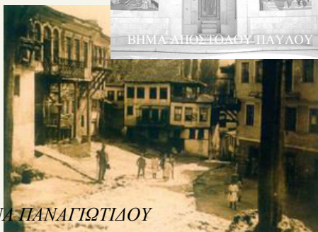
ΕΙΡΗΝΗ ΛΑΖΑΡΟΠΟΥΛΟΥ-ΔΕΣΠΟΙΝΑ ΠΑΝΑΓΙΩΤΙΔΟΥ

τάξεων, παρθηναγωγείον εξατάξιον και δύο μικτά νηπιαγωγεία. Από Βερροίας υπάρχει σιδηροδρομική γραμμή ένθεν μεν μέχρι Μοναστηρίου ένθεν δε μέχρι Θεσσαλονίκης» .(ΣΚΡΙΠ 17/10)