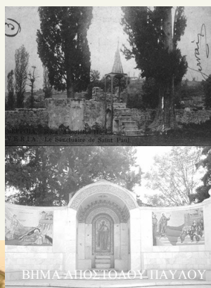
ΒΗΜΑ ΑΠΟΣΤΟΛΟΥ ΠΑΥΛΟΥ