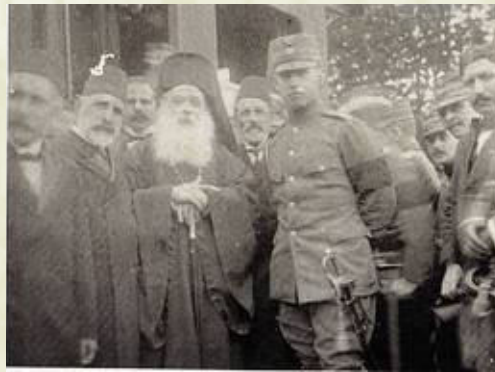
Ο Μητροπολίτης Καλλίνικος και ο Τούρκος Δήμαρχος Αλή Χαλίλ Βέης υποδέχονται τον ελληνικό στρατό.

χρόνια έζησαν μαζί, κι αν δημιουργούνταν εντάσεις δεν έφταιγε ο λαός. Αυτοί που ήταν ψηλά, που διοικούσαν, που αποφάσιζαν, που