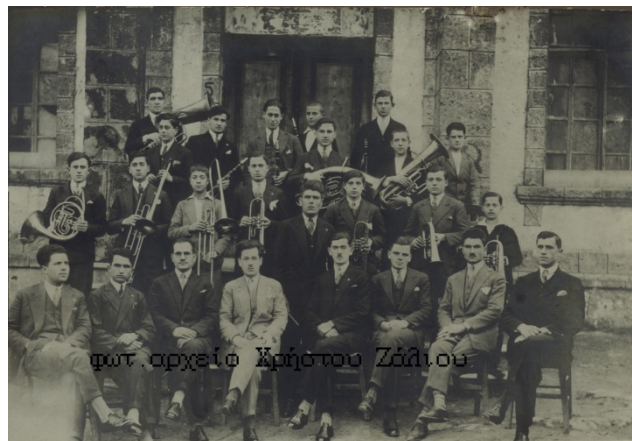
Το διοικητικό συμβούλιο της "Αθηνάς" με ένα τμήμα της φιλαρμονικής του συλλόγου στις 9/12/1928

Το 1928 η φιλαρμονική της "Αθηνάς" με αρχιμουσικό τον Κοφινά, έκανε πρόβες στο Παρθεναγωγείο, εκεί που είναι σήμερα το 4 ο δημοτικό σχολείο.