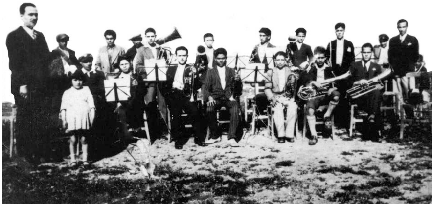
Η μπάντα της Αθηνάς το 1933 στο χώρο του σημερινού πάρκου που τότε ήταν αλάνα και χρησίμευε για γήπεδο (στο σημείο που σήμερα είναι οι λίμνες)