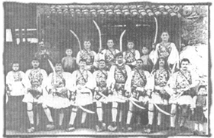
Μπουλούκι από Μπούλες με το Ζουρντζή Μήτρο Χαϊβάνο το 1911.

Ο ιστορικός της Νάουσας Ε. Σιουγιαννάκης στο βιβλίο του Ιστορία της πόλεως Ναούσης , σελ. 54, Εν Εδέσση 1924, αναφέρει μόνο την ύπαρξη γενισαρικών και κλέφτικων ομίλων