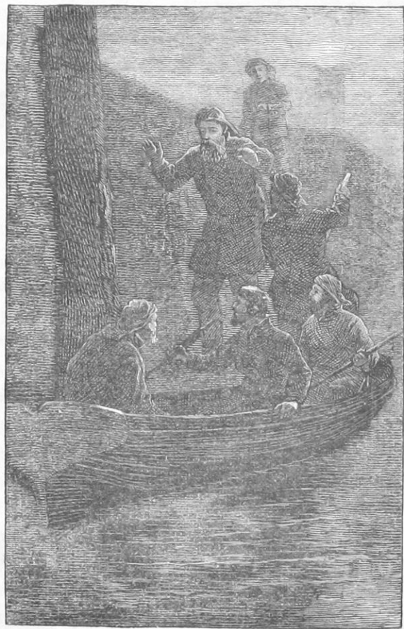
ΜΙΛΑΡΗΝ ΤΖΕΝΑΖΕΣΙΝΙΝ ΚΕΤΙΡΙΑΜΕΣΙ

Τετέμ άχ τζεκερέκ χατουνά χαπερ βερμεγέ κίττι,