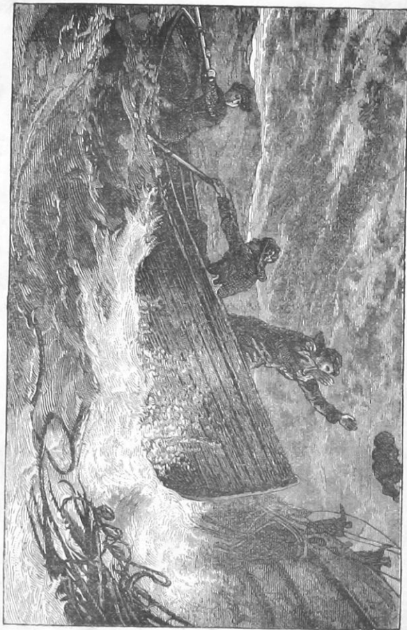
ΠΙΡ ΤΖΟΤΖΟΥΤΟΝ ΧΕΛΑΣΗ

βερτεσί σουτάν γιοκαρή τουρούγιουρ ίτι ισέ τε, ού- ζερνιτέν άρά σηρά ταλγαλάρ χήζ ιλέ κετζιγι ί- τζούν κειμιτεκιλερ τίρεκλερέ σαρηλμάκλα κεντίλερινί μουχαφαζά έτίγιουρλαρ ίτι. Κεμιγέ γιαναστήκ, άμ- μα ρούζκιαρήν σίιτετινιτέν σεσιμιζί ίσιτιπρέμετι- γιμιζτέν καγιηγημηζά ίπ άτμαλαρηνή ίσαρέπλε άγγλατήκ. Ήπλερ άτηλήκτα καγιηγά παγλατήκ, βέ τετέμ κειμιτεκιλερέ, «Κόρκμαγιην, σιζι κουρτα- ρατζάγής» τεγερέκ τζεσαρέτ βέ τεσελλι βερτί. Πά- τεχου πανά, «Καγιηγά άλά πιλτιγι κατάρ άτέμ άληνήκτα ίπι κέσ» τεγιού έμρ ού τενπίχ, έίνιτζε γιούρεγιμ σηζλατή ζιρα κειμιτέ πίρ κατζ γιούζ κισί πουλουνούπ καγιηγημηζ ίσέ άντζακ γιρμι κισί κό- τούρεπιλίρ ίτι. Ρούζκιαρήν πίρ άζ τεσκιν δλμασή ί- τζούν καγιηγά πίρ κατζ κισί άλά πιλειτζέκ κατάρ κειμιγέ γιακλαστήκ. Πού έσνατέ κουβερτετέ τουρ- μούς πίρ άτέμ πιζέ τζηκνήν κίπι πίρ σεί άτή' τε- τέμ άνή τουτουόπ «Μουκαγιέτ δλ» τεγερέκ πανά τεσλιμ έίλετί. Ήλιμέ άλτήγημητά πακίήμ κι τζη- κνήν έσγια για μούτζεβχεράτ δλμαγιηπ ούτζ τόρτ γιασήνητά πίρ τζοτζούκ ίτι. Ήτέμ τόνούπ, καγιηγά ταχά πίρ σεί άλμακτά ίκέν, κονόσουμούζ Μρ. Μίλαρ άνά ότετέν νελμεκτέ δλάν χειπέτλι ταλγαγιή κόσ- τερτί. Πίρ τακικέ ταχά γαφιλ πουλουνοά ίτικ, κα- γιηγημηζ τέβριλίπ γάρκ δλατζάκ ίτικ. Πίς σέριαν