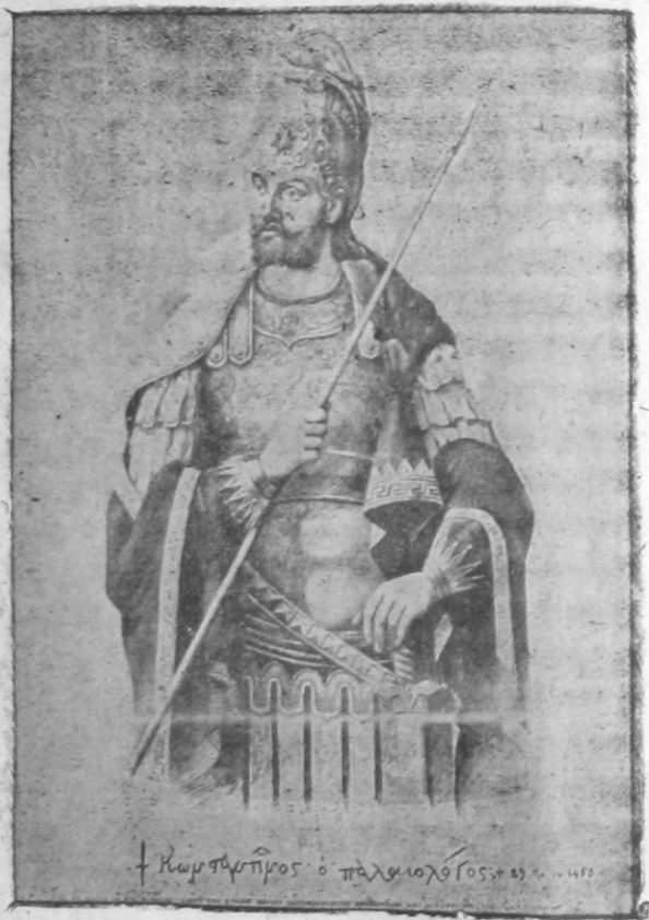
† Κωνσταντῖνος ὁ Παλαιολόγος, 1483