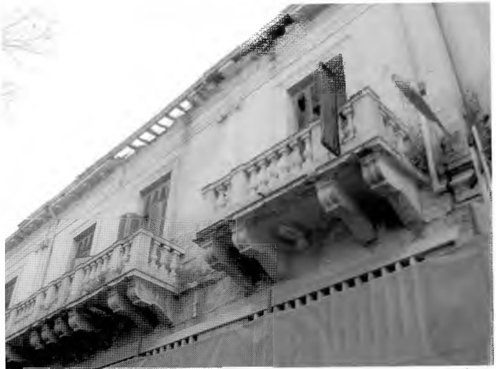
Φωτο 5: Εγκαταλελειμένο κτίριο πάνω στη διαχωριστική γραμμή

Την Κυριακή των Βαΐων πηγαίνοντας στο αεροδρόμιο για την επιστροφή μας, σταματήσαμε