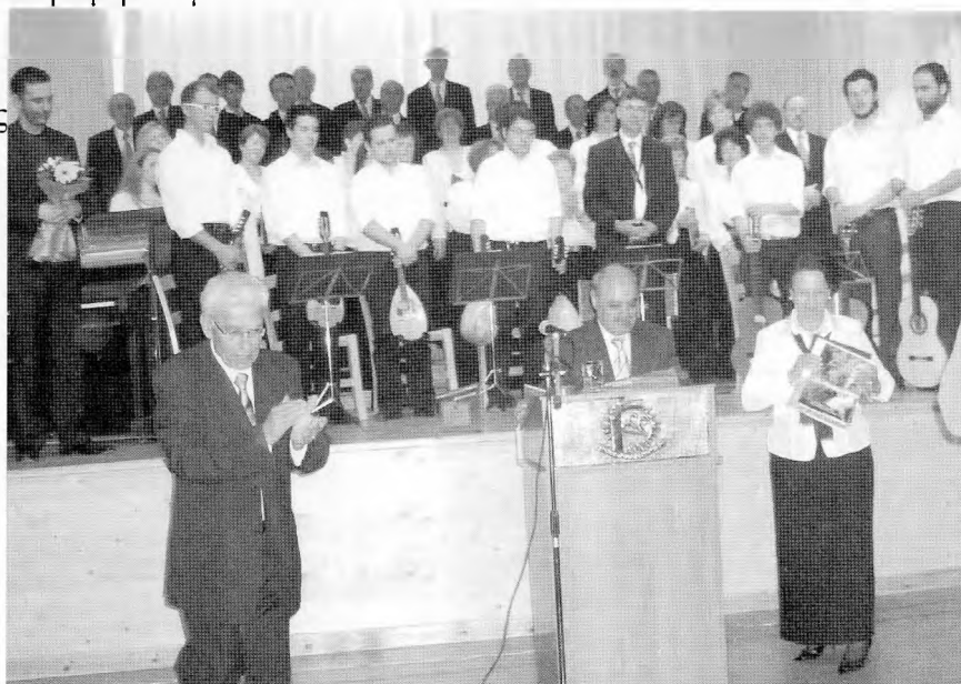
φωτο.1: Ανταλλαγή αναμνηστικών

Το Δημοτικό Μουσείο “ΘΑΛΑΣΣΑ” στην Αγία Νάπα, το οποίο άνοιξε νέους πολιτιστικούς δρόμους για την Κύπρο και δέχεται χιλιάδες επισκέπτες κάθε χρόνο, και όπως διάβασα σε τοπική εφημερίδα της Αγίας Νάπας, κατατάχθηκε ανάμεσα στα καλύτερα μουσεία της Ευρώπης