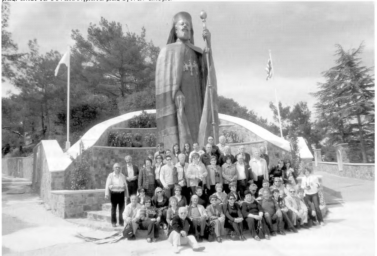
Φωτο 4: Οι Εκδρομείς μπροστά στο άγαλμα του Μακαρίου

Σταθμό όμως στις περιηγήσεις μας αποτελεί το προσκύνημά μας στην Ιερά Μονή του Κύκκου στο όρος Τρόδος . Πολύς ο δρόμος από το "PAVLO NAPA", το ξενοδοχείο όπου μέναμε. Τίποτε όμως δε μας σταμάτησε. Είχαμε σύμμαχο και τον καιρό. Έτσι, ύστερα από τρεις ώρες (την 27η Μαρτίου) και μετά από ανάβαση με στροφές, φτάσαμε στο μοναστήρι, κτισμένο σε